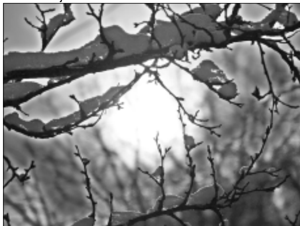
Uz labāku sauli veroties. Iesūtīja Zane Začeva no Kubulu pagasta.