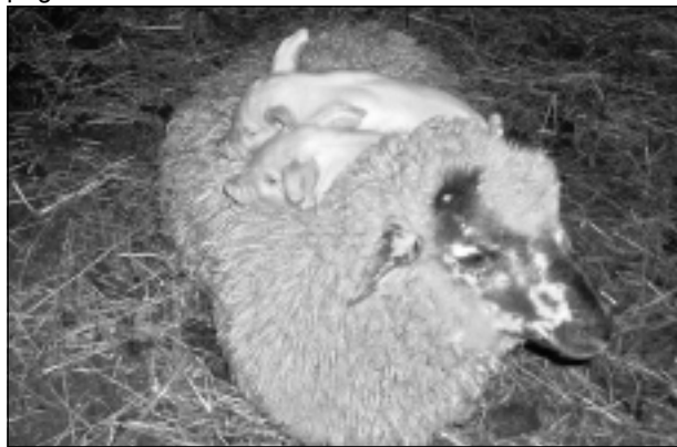
Jāizmanto iespējas sasildīties.