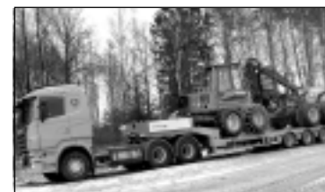
Treilera pakalpojumi. Tālr. 29113399.

Finansu kompānija pārdod apbūves gabalu Skolas ielā 70, platība 2149 m 2 . Cena pēc vienošanās. Tālr. 29199255.