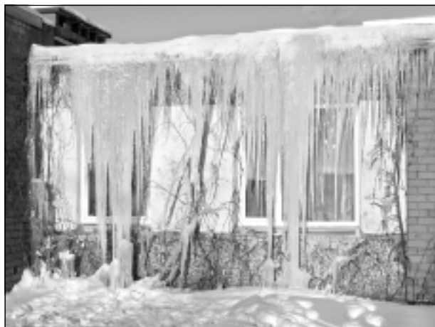
Ledus brīnums.

Katra mēneša labākās fotogrāfijas autors balvā saņems žurnālu komplektu. Maija tēma "Nav vērts braukt apkārt zemeslodei – skaistums ir tepat". Fotogrāfijas var iesūtīt pa pastu – Balvi, Teātra ielā 8, LV-4501, vai elektroniski – vaduguns@apollo.lv. Pie foto obligāti norādāms vārds, uzvārds (vēlams - tālrunis).