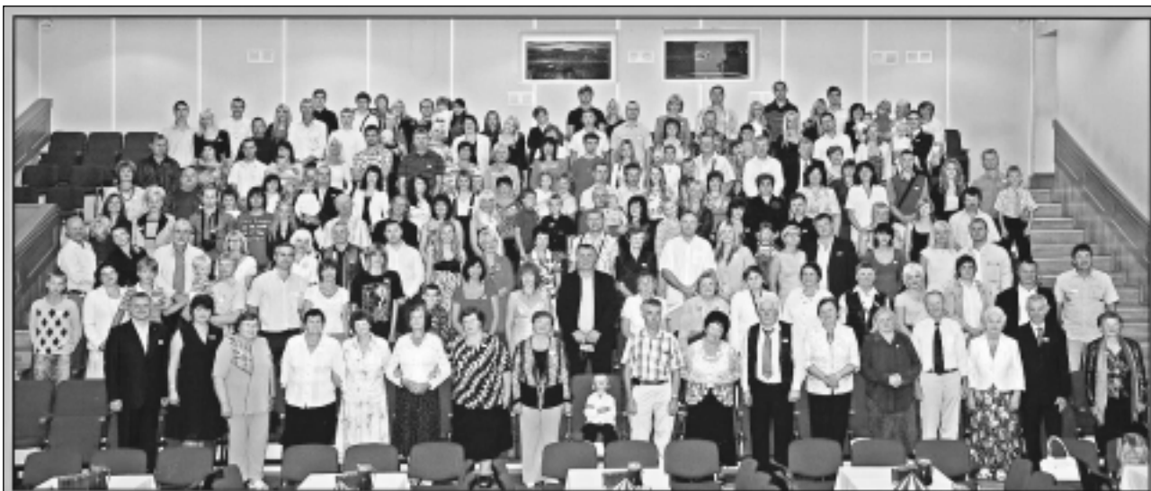
Ločmeļu dzimtas salidojums 2010

Visi kopā. Katrs dzimtas salidojuma dalībnieks saņēma fotogrāfiju, kas atgādinās par sirsnīgajiem radu pulkā aizvadītajiem mirkļiem. Tiekoties Lielvārdē, dzima jaunas idejas un tālejoši plāni, jo Ločmeļu dzimtas koks joprojām turpina kuplot uz sazaroties.