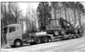
Treilera pakalpojumi. Tālr. 29113399.