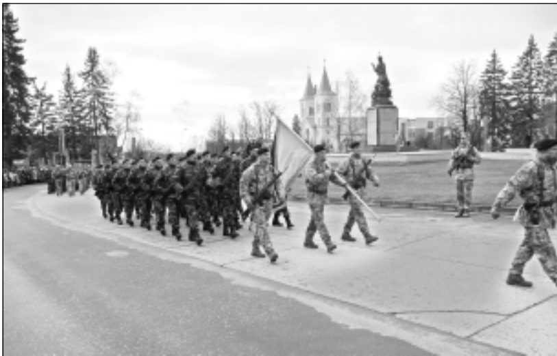
Parāde pie Latgales Māras pieminekļa. Atbalsta centra "Rasas pērles" bērni pirmo reizi vēroja karavīru un zemessargu parādi, kas notika Rēzeknē pie Latgales Māras pieminekļa.