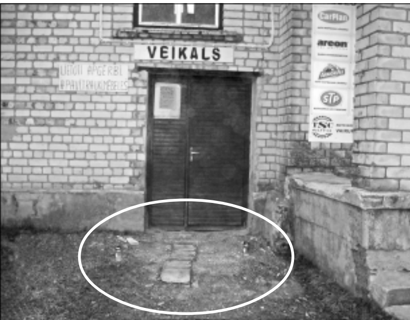
Mikla. Kas un kāpēc Mirušo piemiņas mēnesī pie veikaliem Tilžā nolika aizdegtas svecītes, joprojām ir mikla.