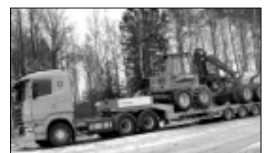
Treilera pakalpojumi. Tālr. 29113399.