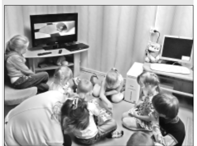
Modernizēta lasītava. Rugāju novada lauku un Rugāju ciema bērniem pieejama modernizēta pirmsskolas vecuma bērnu lasītava.

Biedrība "Jaunatne lauku attīstībai" Rugājos īstenojusi projektu "Labvēlīgu apstākļu un perspektīvu radīšana jaunatnes attīstībai laukos" ar mērķi izveidot pulcēšanās vietu jauniem un aktīviem cilvēkiem, kuri vēlas kvalitatīvu un saturīgu pavadīt brīvo laiku, iesaistīties sabiedriskajās aktivitātēs, izglītoties vai nodarboties ar labdarību. Tā kā Rugājos veiksmīgi darbojas jauniešu centrs skolas vecuma jaunatnei, biedrība "Jaunatne lauku attīstībai" lielākoties pulcē kopā jauniešus, kuri jau beiguši vidusskolu. Projekta laikā iegādātas mēbeles un aprīkojums semināriem. Projekta kopējās izmaksas - Ls 2419,12, ELFLA finansējums - Ls 2177,21.