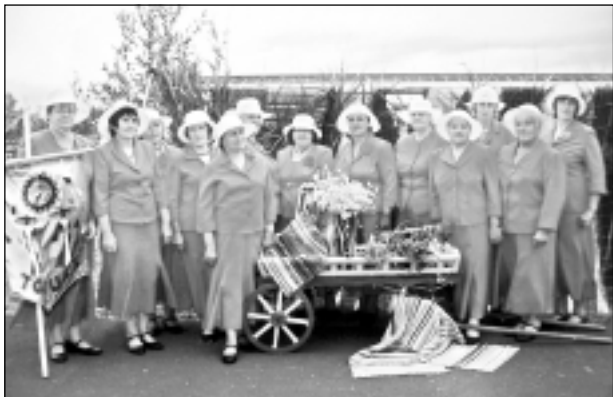
Eiropas senioru deju kopas "Tonuss" dalībnieces uzlaiko jaunās kurpes. Projekta rezultātā izgatavoti 19 sieviešu deju korpju pāri, pasūtījumu veica SIA "Kristāla Kurpīte".

Projekts Nr. 10-07-LL04-L413203-000008 "Prieka virpulī" realizēts Rugāju novada Lazdukalna pagastā no 17.09.2010. līdz 30.07.2011. Tas realizēts ātrāk, nekā paredzēja noslēgtā vienošanās ar Lauku atbalsta dienestu. Projekta kopējās izmaksas - Ls 505,78, finansējums no Eiropas Lauksaimniecības Fonda Lauku attīstībai (ELFLA) - Ls 455,20, pašvaldības finansējums - Ls 50,58. Tā kā gadu mijā mainījās PVN likme, tad starpību - Ls 4,18 - sedza kolektīva dalībnieces.