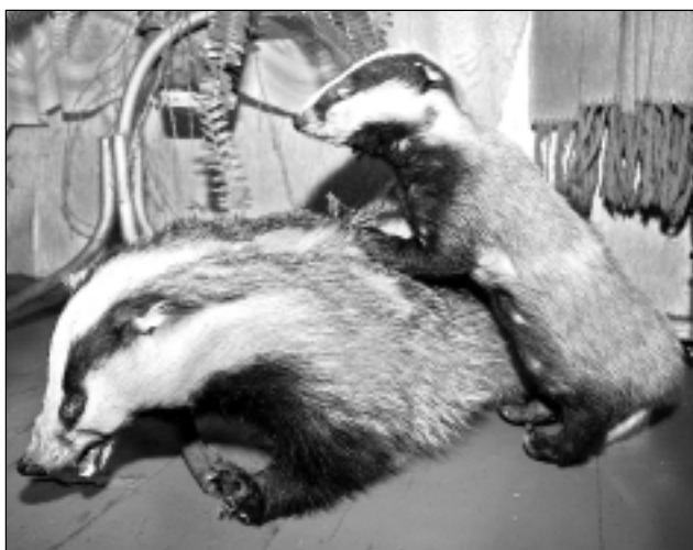
Āpšu ģimene. Šie āpši ir I.Lidakas aizvesto āpsēnu radnieki. Diemžēl šiem dzīvnieciņiem nepaveicās - viņi aizgāja bojā un kļuva par izbāzeņiem.