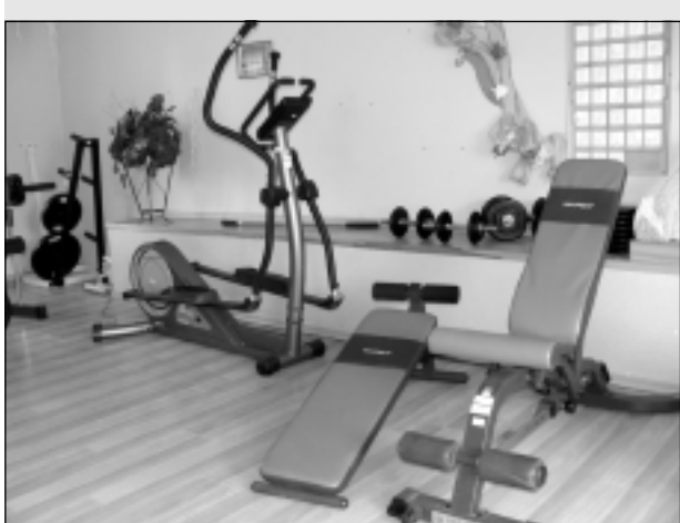
Sasniegts projekta uzdevums. Iegādāti un uzstādīti dažādi trenāžieri jauniešu centrā "Saulesziems".