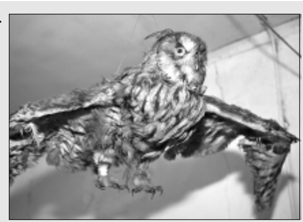
Ausainā pūce no Somijas.