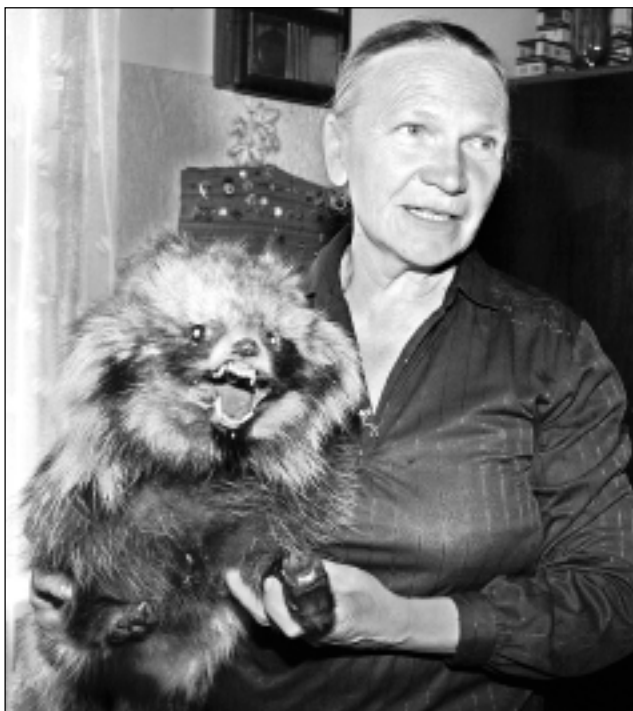
Visvecākais eksemplārs. Vissenāk izgatavots šis jēnota izbāzenis. Neraugoties uz ilgo laiku – 15 gadiem, ko tas nostāvējis saimnieces istabā, jēnots ir ļoti labi saglabājies.