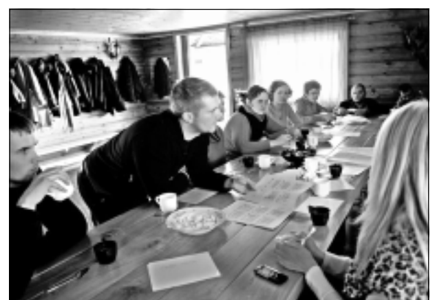
Aktīvi jaunieši Rugājos. Realizēts pirmais biedrības "Jaunatne lauku attīstībai" Leader projekts.

Projekta mērķis - iegādāties tehnisko nodrošinājumu biedrības "Bastions Balvi" bāzes pilnveidošanai, lai nodrošinātu kvalitatīvus sporta un kultūras pasākumus Balvu un tuvāko novadu iedzīvotājiem. Veidot jaunas tradīcijas sporta svētkos un kultūras pasākumos.