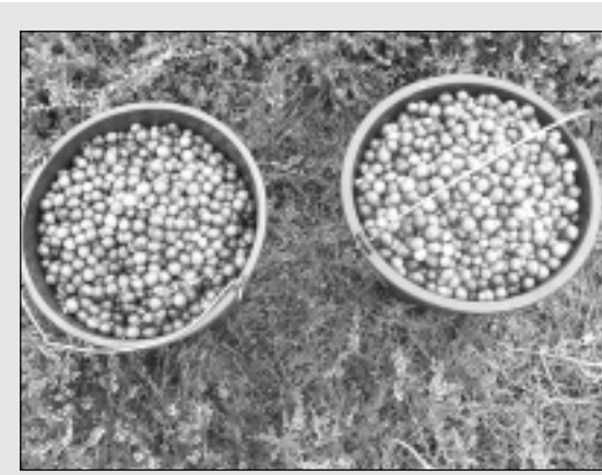
Naudas-kalna purvā lasa dzērvenes.