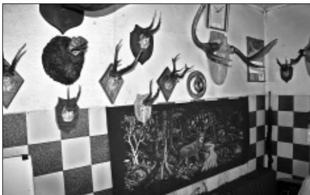
Brīvbrīdi sagatavoja I.Tušinska