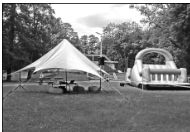
Piepūšamās atrakcijas sporta un kultūras pasākumu aktivitāšu dažādošanai. Biedrība "Bastions Balvi" realizēja projektu Nr. 10-07-LL04-L413202-000008 "Jautrais skrējiens".

Realizējot projektu, sasniegts tā mērķis - sakopt, pielāgot un labiekārtot vidi aktīvam un kvalitatīvam dzīvesveidam Lazdulejas pagasta iedzīvotājiem: ierīkot peldvietu, sakopt un labiekārtot Lazdulejas pagasta centrālo ielu. Lai realizētu projektu, veica divus uzdevumus: 1. sakopa un labiekārtoja pludmali: diķa malā izveidoja pludmali ar smilts pamatni, ierīkoja ugunsкура vietu, uzstādīja lapeni, tualeti un ģērbtuvu, četrus solus un trīs atkritumu urnas; 2. sakopa un labiekārtoja galveno Egļuciema ciema centrālo ielu: ieklāja bruģi 150 m 2 gājēju celiņiem, izveidoja strūklaku, sakārtoja ūdens novadīšanas kanalizāciju, iestādīja ilggadīgos stādījumus, iesēja zālāju, uzstādīja divus solus un divas atkritumu urnas.