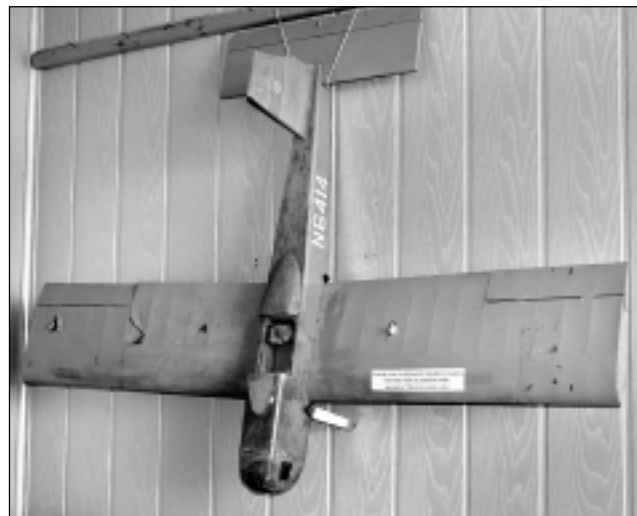
Viens no pirmajiem. Latvijā viens no pirmajiem iekšdedzes modeļiem, kuru vadīja ar paštaisītu radio aparāturu. Tas bija 70.gadu vidū.