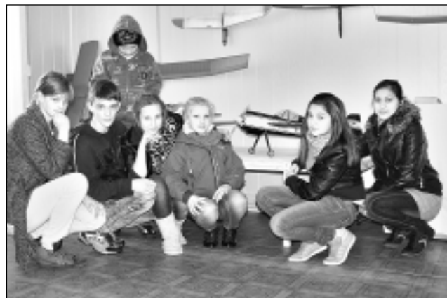
Grib nofotografēties visi. Pusaudžiem lidmodeļi izraisa vislielāko interesi, un iemūžināt sevi ar tiem vēlas arī Tilžas internātpamatskolas 7. klases audzēkņi.