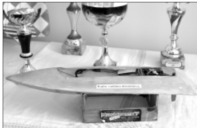
Ari laiva un apbalvojumi. Izstādē skatāma arī radiovadāma ātruma laiva un sacensībās izcīnītie kausi. Tie, kuri sajūt savas spējas un uzvaras garšu sacensībās, arī profesiju izvēlas saistībā ar aviācijas vai raķešbūvniecības nozarēm.