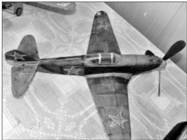
Istabas lidmodelis. Tas darbojas ar gumijas motoru, kura svars ir tikai 0,5 grami, un ir īstu lidmašīnu kopija.