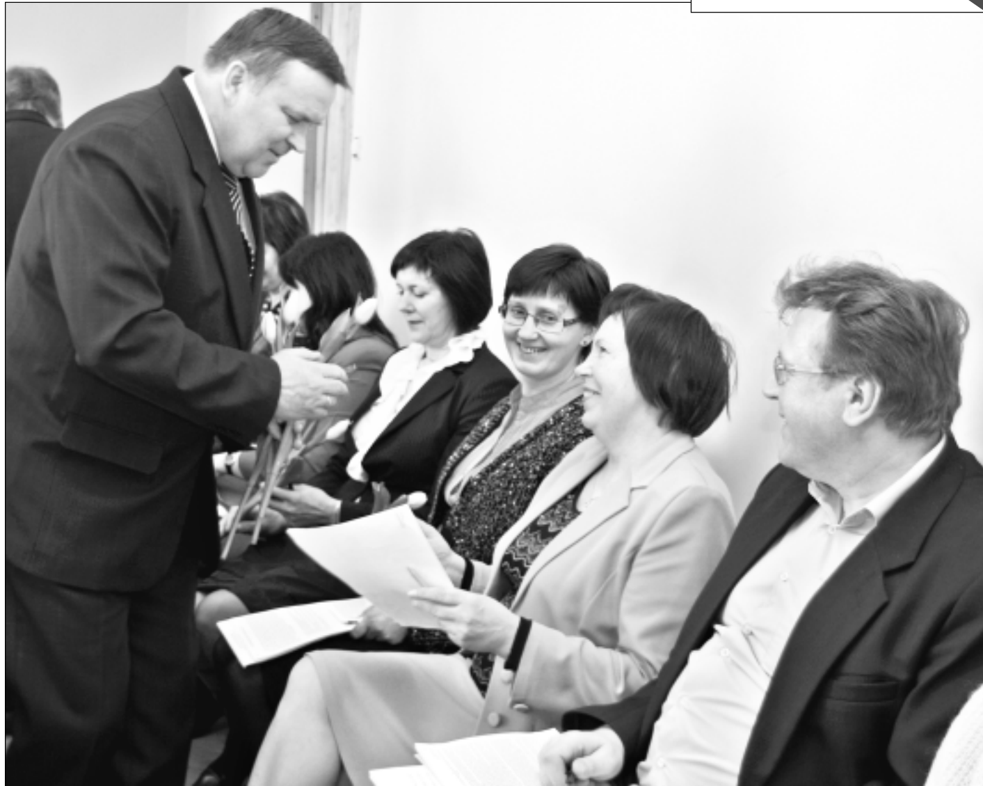
Pirms domes sēdes. Vakar daļā dzimuma pārstāves lutināja ne tikai ģimenēs, bet arī darba kolektīvos. Balvu novada domes deputātiem un pašvaldības speciālistēm viri uzvalkos dāvāja tulpes.