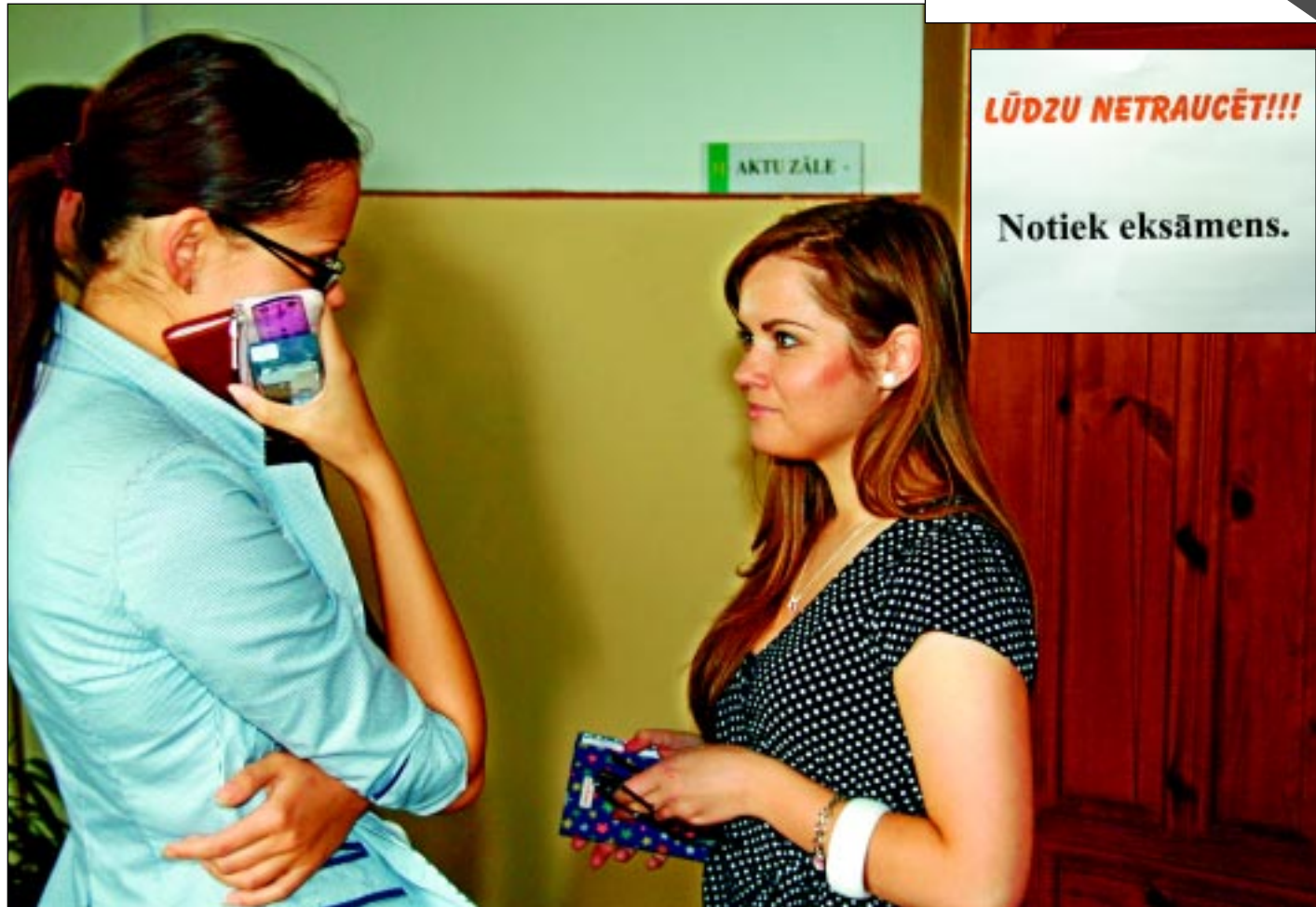
Pirms eksāmena. Jaunieši, jautāti, kāds viņiem noskaņojums pirms matemātikas eksāmena, atsmēja, ka ļoti labs. Jāatzīst, uztraukums, kas tobrīd valdīja skolā, bija bezmaz vai ar roku sataustāms. “Mums izdosies!” apgalvoja skolēni, kuri pavisam drīz dejos vālsī izlaidumā.

Vides aizsardzības un reģionālās attīstības ministrija aktualizējusi plānošanas reģionu un pašvaldību teritorijas attīstības indeksa vērtības, izmantojot jaunākos statistikas datus par 2011. gadu, kas raksturo teritoriju sociāli ekonomiskās perspektīvas. Indeksi nosaka valsts līdzfinansējuma apmēru pašvaldību īstenotajos ES struktūrfondu un Kohēzijas fonda līdzfinansētajos projektos – jo zemāks teritorijas attīstības indekss, jo augstāks valsts budžeta dotācijas un zemāks pašvaldību līdzfinansējuma īpatsvars. No 110 novadiem 109. vietu ieņem Baltinava ar teritorijas attīstības indeksu - mīnus 1,765. 82. vietā ir Balvu novads – mīnus 0,591; 97. vietā ir Rugāju novads – mīnus 1,056 un 103. vietā ir Viļakas novads – mīnus 1,349.