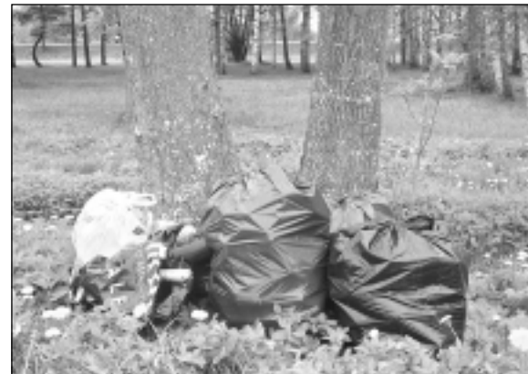
Atkritumu maisi. To, ka atkritumu maisi atradās pie koka atpūtas vietā, apliecina arī šī fotogrāfija.

"Ejot uz poliklīniku, atpūtas vietā, kur atrodas soliņš, pie koka ievēroju vairākus atkritumu maisus, kuros atradās gan drēbes, gan citas mantas, piemēram, automašīnu stiklu tīrītāji iepakojumā kartona kastēs. Interesanti, vai tas ir jauns veids atkritumu apsaimniekošanā - nolikt savus atkritumu maisiņus ceļa malā pie soliņa, kas domāts atpūtai? Vai arī tā ir sava veida "labdarība"? Jautāja kāda balveniete, kurai nesen bija nācies doties uz poliklīniku un viņa bija izvēlējusies ceļu gar tā saukto "gāzes kantori".