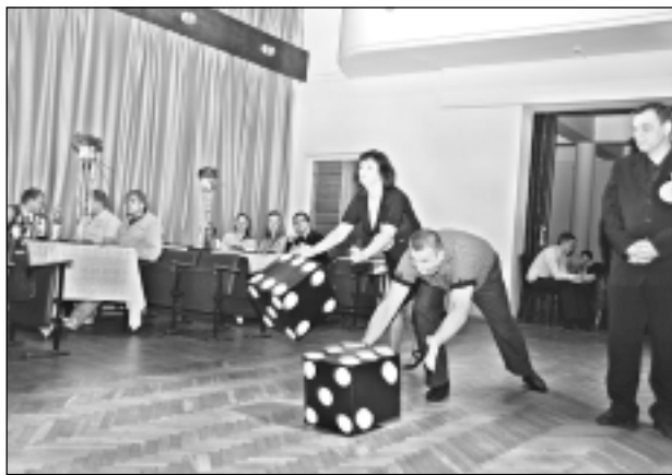
Met kauliņus. Kādi skaitļi uzkrita, tik lapiņas no tualetes papīra rullīa drīkstēja noraut. Bija jautri, jo divu metamo kauliņu ciparu summa, kas ik pa brīdīm uzkrita, nepārtraukti mainījās – no vismazāk iespējamajiem 2, līdz pat 12 punktiem.