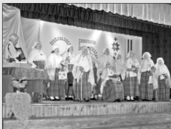
Medņevas sievas svin jubileju.