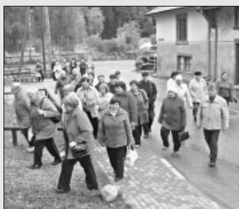
Seniori dodas ekskursijās.