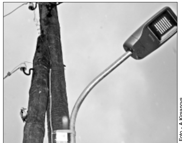
Lappusi sagatavoja A.Ločmelis

Jaunās spuldzes. Celtnieku, Ķiršu, Rūpniecības, Pilsoņu un Ziedu ielas posmos uzstādīti 52 LED gaismekļi.