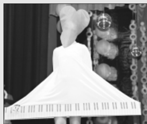
Iejūtas modes pasaulē.