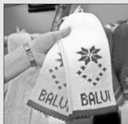
Top cimdi ar Balvu simboliku.