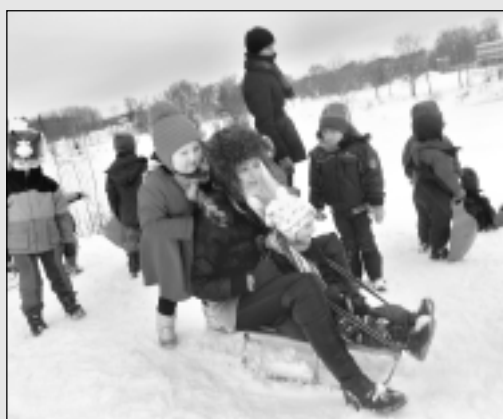
Rugāju novada vidusskolā.