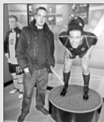
Ziemeļu Venēcijā Amsterdamā.