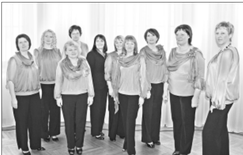
Viļakas kultūras nama vokālais ansamblis "Cansone". Šis dziedošs sievietes sevi koncertos un skatēs pierāda ne pirmo reizi, un viņu sniegunam skatītāji aplaudē ne tikai Viļakā.