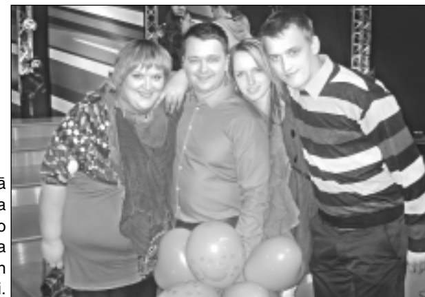
"Jauno žurnālistu skolas" lappusi sagatavoja S.Gugāne