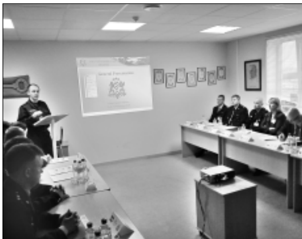
Viļakas pārvaldes robežsargu prezentācija. Šengenas novērtēšanas komisijas pārstāvji devās vizītē arī uz Viļakas pārvaldes Pededzes robežsardzības nodaļu.

Jāpiebilst, ka uz Latvijas jūras robežām Šengenas prasību piemērošanu Šengenas dalībvalstu komiteja vērtēja pērnā gada maijā. Savukārt gaisa robežas kontroles sistēmas atbilstību komisija vērtēja 2012.gada jūlijā. Abās iepriekšējās pārbaudēs Latvijas jūras un gaisa robežas kontroli atzina par prasībām atbilstošu.