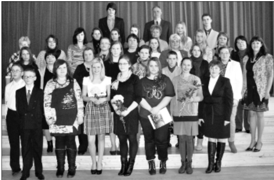
Noslēguma pasākumā. Jaunrades dzejas konkursa dalībnieki kopā ar skolotājiem.