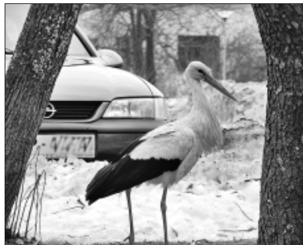
Pavasaris klāt!

Katra mēneša labākās fotogrāfijas autors saņems balvu. Fotogrāfijas var iesūtīt pa pastu – Balvi, Teātra ielā 8, LV-4501, vai elektroniski – vaduguns@apollo.lv. Pie foto obligāti norādāms vārds, uzvārds (vēlams - tālrunis).