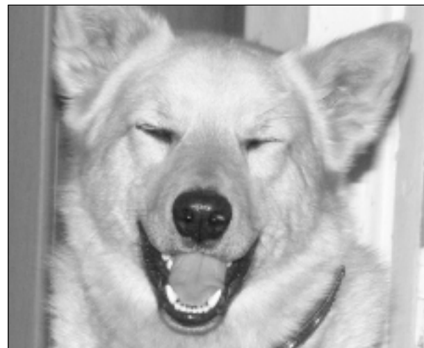
Ha, ha, ha!