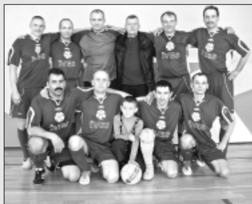
Balvu "Īves" komanda.