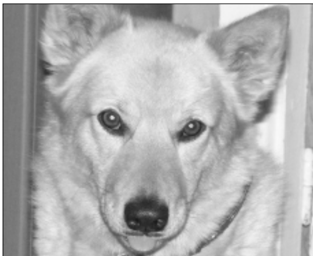
April, april! Iesūtīja Andris Keiselis.

Katra mēneša labākās fotogrāfijas autors saņems balvu. Fotogrāfijas var iesūtīt pa pastu – Balvi, Teātra ielā 8, LV-4501, vai elektroniski – vaduguns@apollo.lv . Pie foto obligāti norādāms vārds, uzvārds (vēlams - tālrunis).