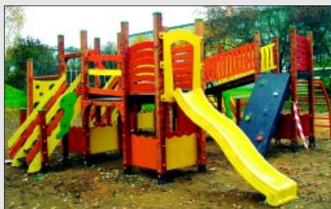
Jauni rotaļu laukumi Balvos.