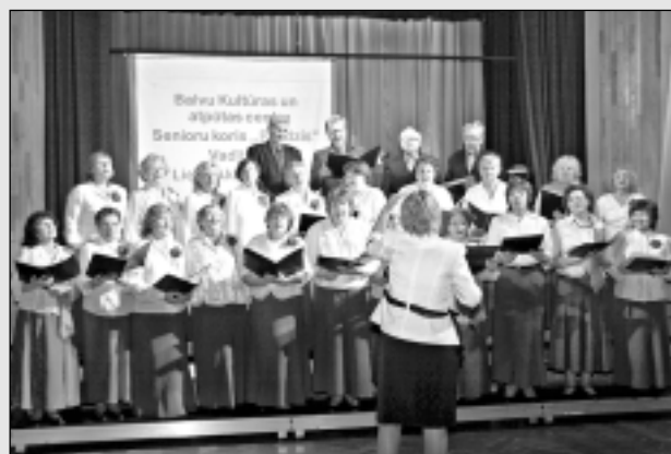
Atpūšas senioru svētkos.