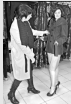
Stila pārvērtības "Pretī zelta rudenim".