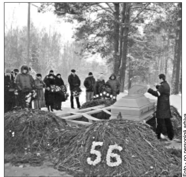
Uzņēmuma moto: pavadīt skaisti un ar godu. Firma "Smiltājs K." īpaši padomājusi arī par noformējumu, no ziediem izveidojot aizgājēja gadu skaitli.

palīdzētu ar to, ko vajag. Ir daži, kam nevajag palīdzēt organizēt bēres, vien atgādāt zārku, tādēļ ir visas iespējas sarunāt sev vajadzīgo variantu," apliecina "Smiltājs K." vadītājs. Viņa vadītā uzņēmuma moto ir: katras bēres noorganizēt kā pirmās un pēdējās. "Nešķirojam, cilvēks ir turīgs vai mazāk turīgs. Šajā gadījumā tas nav primārais. Galvenais, lai ikviens pēdējā gaitā tiktu pavadīts skaisti un ar godu," uzskata uzņēmējs.