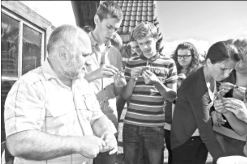
Mācās gatavot. Jauniešiem patika pašiem darboties un veidot no māla svilpauniekus.

Ekskursijas noslēgumā Indrā, zemnieku saimniecībā “Smaidi”, apmeklēja aitu vilnas pārstrādes cehu. Tur daļēji iepazīs ar šuvēja profesiju, jo redzēja šujam segas un spilvenus, daļēji - ar lopkopja un zemnieka profesiju. Varēja ne tikai apskatīt, bet arī iegādāties kvalitatīvās aitu vilnas segas un citus izstrādājumus.