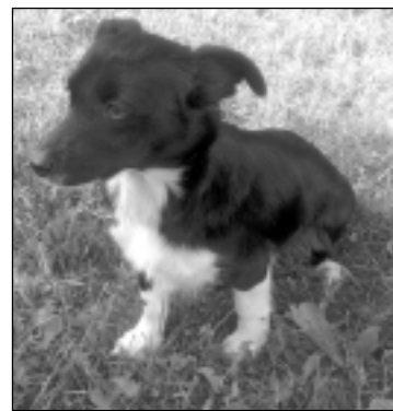
Piekļidusi jautra suņu meitenīte. Tālr. 26490610.