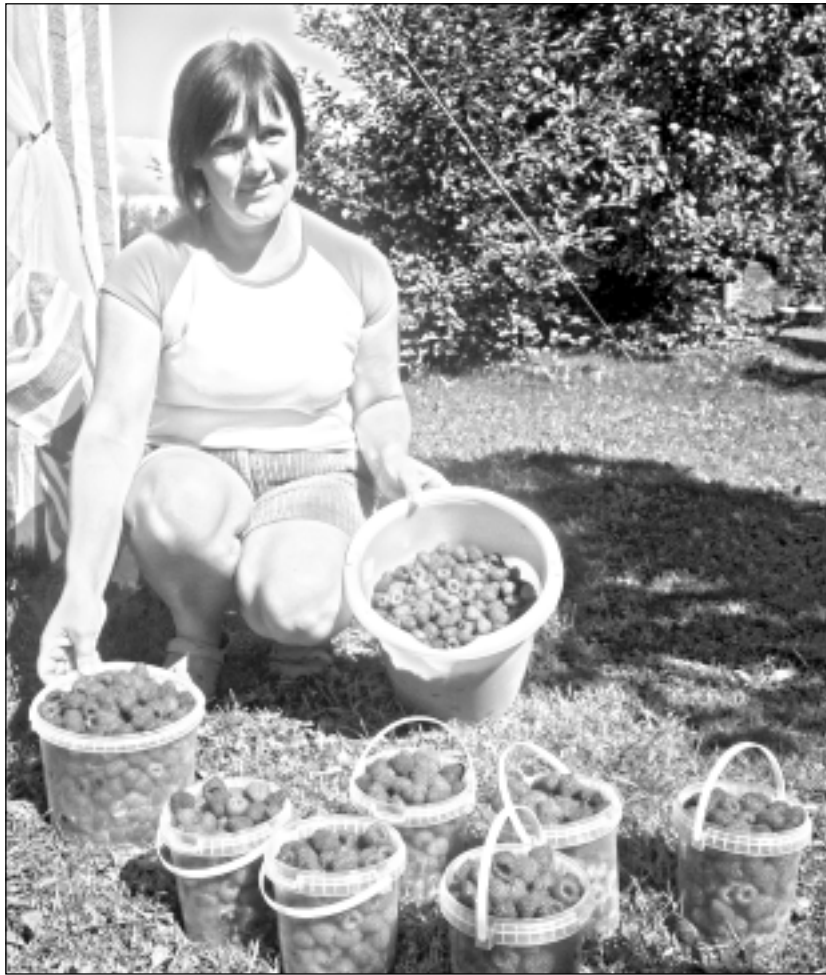
Pilni spaiņi sarkano ogu. Šogad mūs lutina silts un saulains laiks, tāpēc arī avenes ir saules siltuma piesūkušās, lielas un gardas.