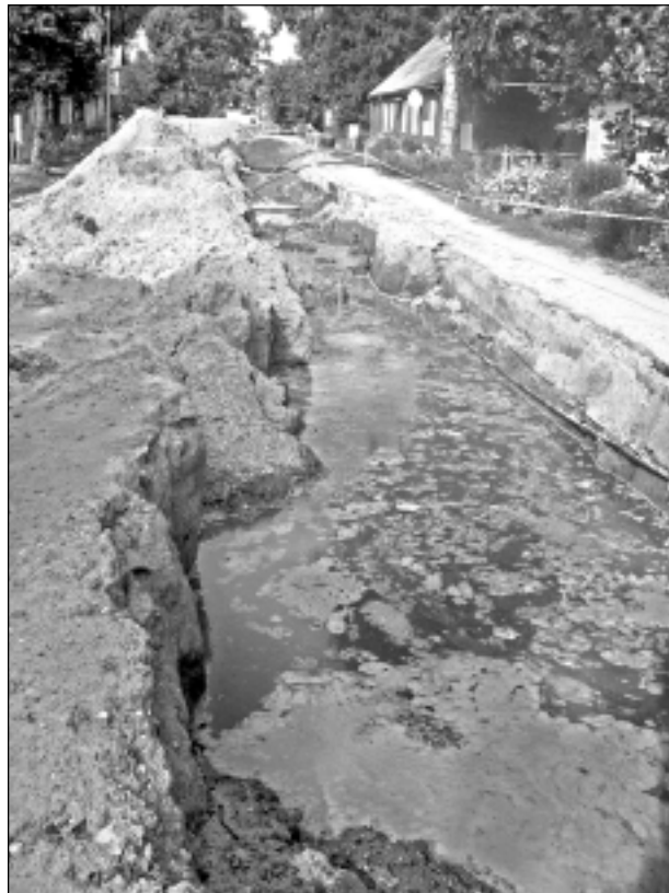
Smirdoņa un dubļi. Izraktās tranšejas Tautas ielā blakus esošo māju iedzīvotājiem sagādā pamatīgas galvassāpes. Sola, ka līdz septembra beigām remontdarbus pabeigs.

Remontdarbus Tautas ielā sola pabeigt divu nedēļu laikā