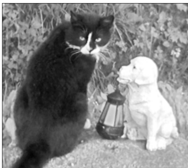
Otrā - iesim pelītēs? Iesūtīja Iveta Medniece.

Katra mēneša labākās fotogrāfijas autors saņems balvu. Fotogrāfijas var iesūtīt pa pastu – Balvi, Teātra ielā 8, LV-4501, vai elektroniski – vaduguns@apollo.lv . Pie foto obligāti norādāms vārds, uzvārds (vēlams - tālrunis).