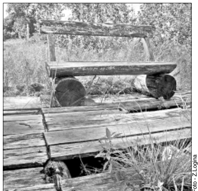
Lappusi sagatavoja Z.Logina

Ielūst uz laipas. Pie Pokratas ezera soliņš novietots uz vecas un satrunējušas koka laipas.