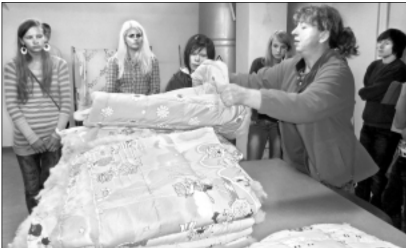
Iepazīst aitu vilnas izstrādājumus. Aitas ekskursanti neredzēja, toties apskatīja vilnas izstrādājumu šūšanas procesu un gatavo produkciju – spilvenus, segas, krēslu paliktnus, siltus zābaciņus u.c.