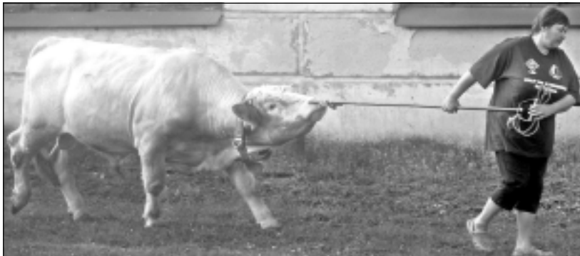
Iespaidīga figūra. Šarolē šķirnes bullis ir pārdošanā. To var iegādāties par 1000 latiem.