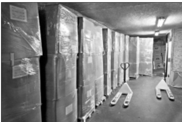
Izejmateriāli. Nelikumīgajā ražotnē policija atrada cigarešu ražošanai nepieciešamos izejmateriālus, tostarp 8,5 tonnas tabakas.