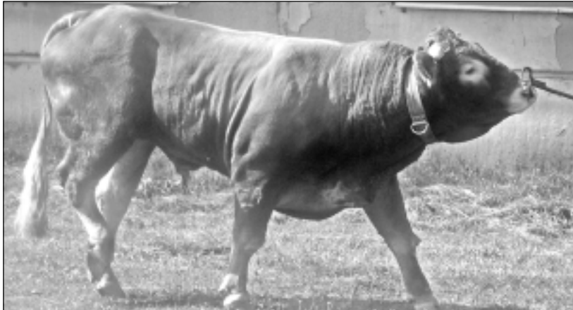
Augstvērtīgs dzīvnieks. Šis ir gaļas šķirnes Limuzīna vaislinieks.