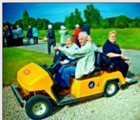
Seniori dodas ekskursijā.