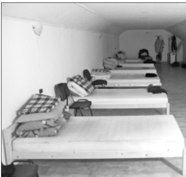
Darbinieku gultasvietas. Strādniekiem bija labiekārtotas gultas un citi sadzīves apstākļi.