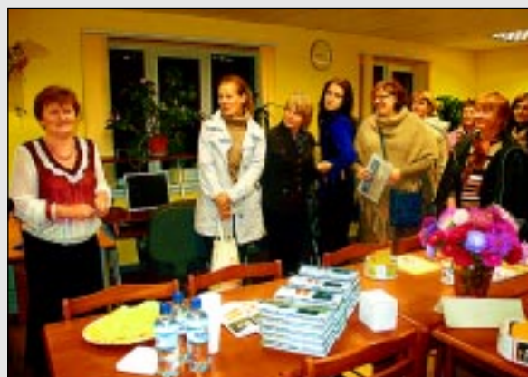
Balvos aizvada bibliotekāru konferenci.