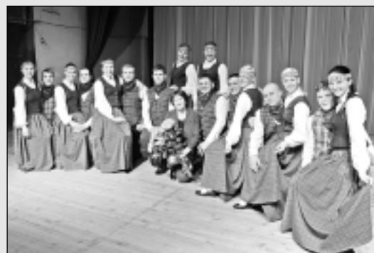
Deju skatē-koncertā gūst labus panākumus.