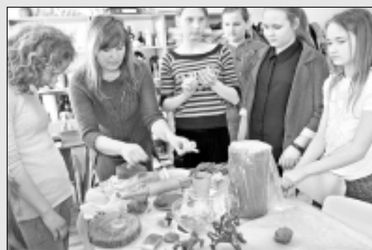
Balvu Mākslas skolā strādā keramiķi.