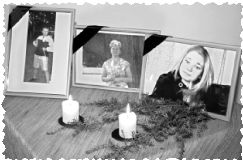
Žiguros sēras. Dzīvību zaudē ģimene...