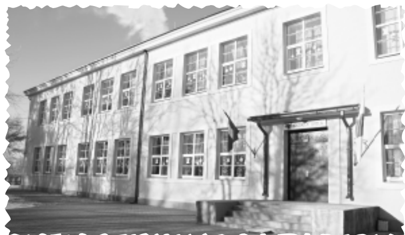
Viļakas novadā slēdz divas skolas.