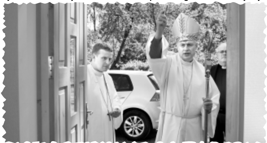
Iesvēta Balvu luterāņu draudzes namu.