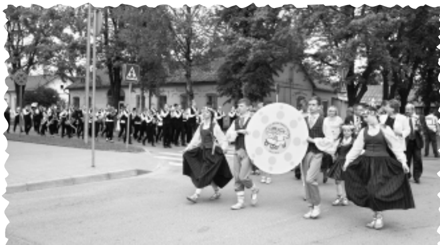
Deju festivālā "Latvju bērni danci veda" piedalās gandrīz 2000 dejojāji.