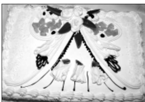
Pārsteigums. Kā katru gadu, arī šogad Zelta pāriem bija sarūpēta skaista un garšīga svētku torte.