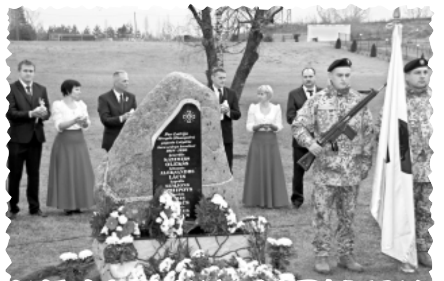
Bērzpilī atklāj piemiņas vietu Lāčplēša kara ordeņa kavalieriem.

Nākamais laikraksta "Vadugums" numurs iznāks 6.janvārī.