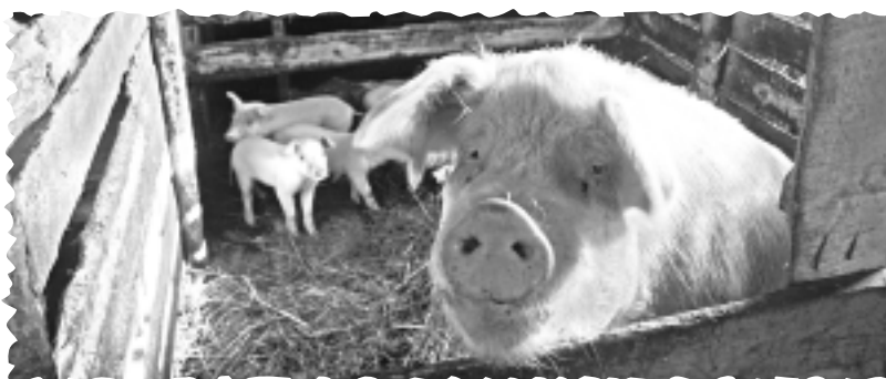
Izplatās Āfrikas cūku mēris.