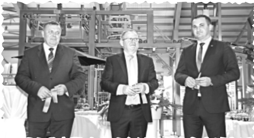
Lutinānu purvā atklāj kūdras ražotni.