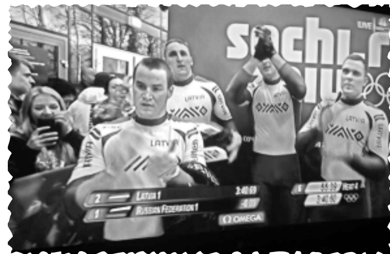
Balviem pašiem savs olimpietis!