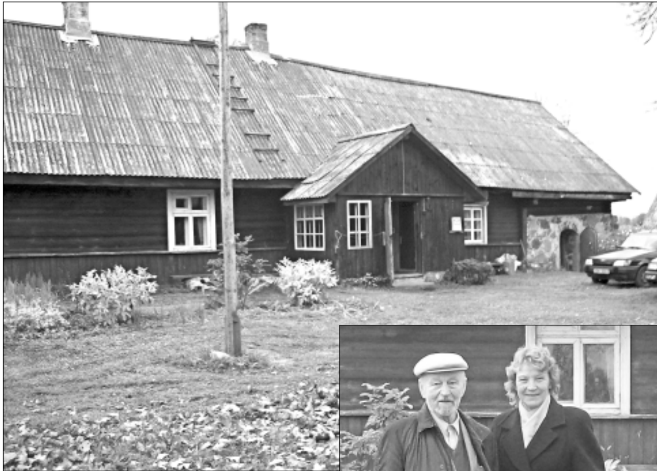
“Cērtēles”. Tādas ir Medņu dzimtas lauku mājas Cesvainē.