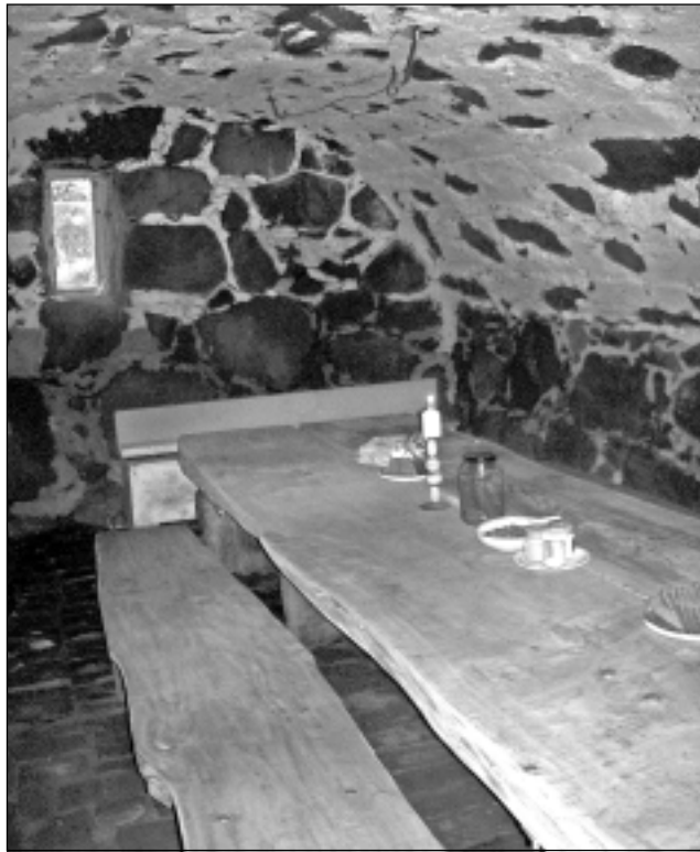
Simtgadīga liecība. Šis varenais galds darināts no dzimtas īpašumā auguša simtgadīga ozola un tagad skatāms “Cērtēlēs”.