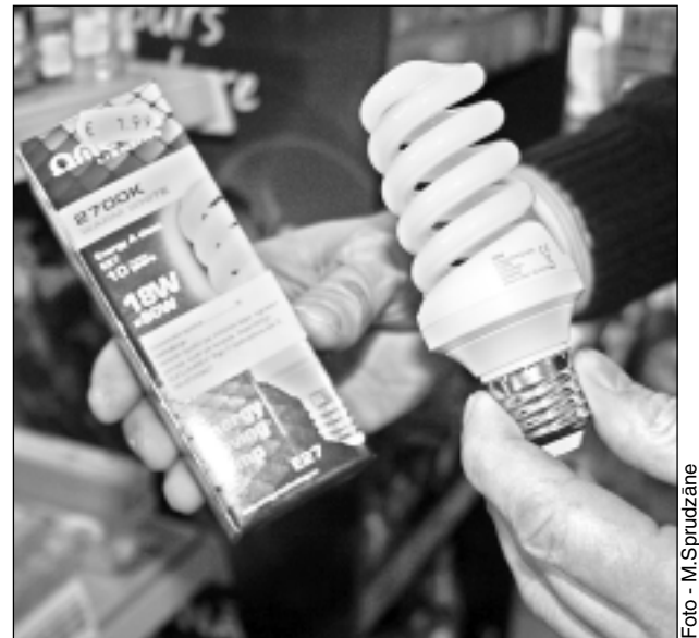
Luminiscējoša spuldze. Šīm spuldzēm, līdzīgi kā kvēlspuldzēm, vairs neparedz ilgu mūžu. Tās jau arī kļūst noiets variants.