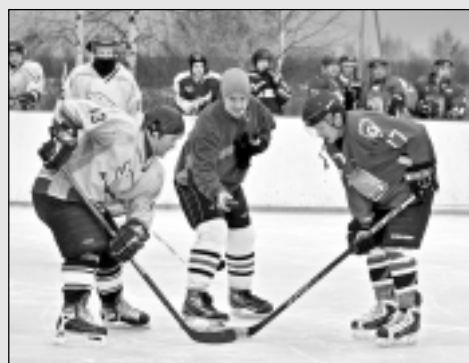
Hokejisti cīnās Lazdukalnā.