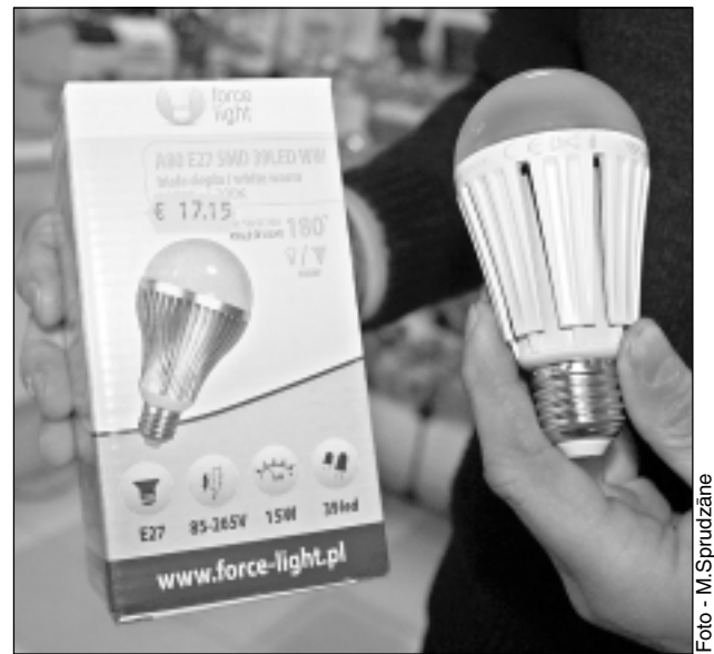
LED spuldze. Pirms iegādes spuldzes tirdzniecības vietās iespējams arī pārbaudīt.