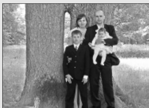
Kad ģimenē abi glābēji...