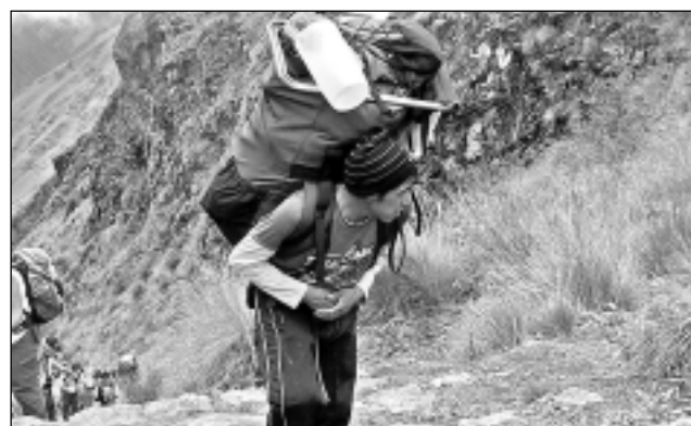
Palīdz nest smagās mugursomas. Porteri jeb nesēji, pirms celt plecos tūristu smagās mugursomas, tās nosver. Svārs nedrīkst pārsniegt 20 kilogramus.