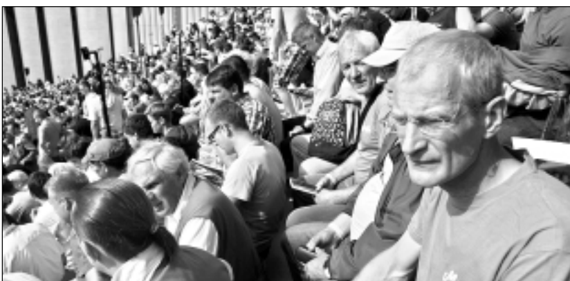
Kora "Mirklis" dziedātāji Mežaparka Lielajā estrādē. Ģenerālmēģinājuma koristi dziesmu starplaikos varēja atpūsties un pasēdēt, vērojot pārējo dalībnieku rosību.