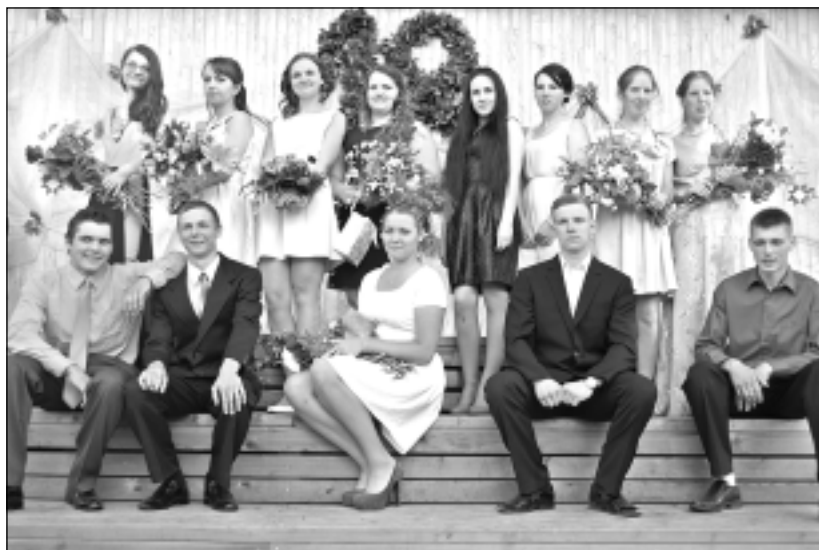
Kopbilde. Baltinavas novada Pilngadības svētku dalībnieki uz skatuves parkā.

Pārdod gaisa kompresoru ar elektromotoru, darba kārtībā. Tālr. 26337211.