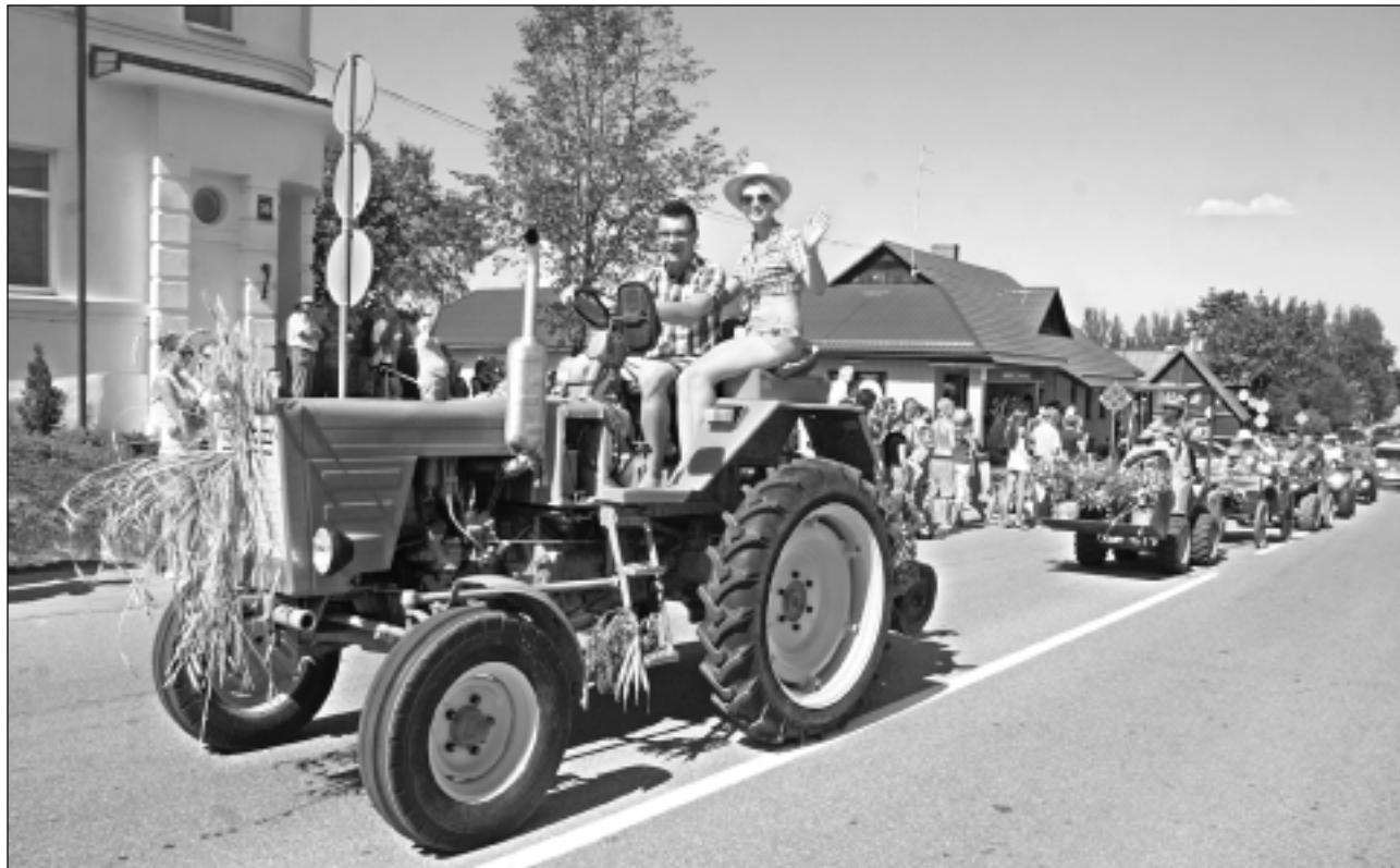
Izraisa skatītāju ovācijas. Katrs tehnikas parādes dalībnieks saņēma sajūsmas un uzmundrinājuma saucienus no skatītājiem.