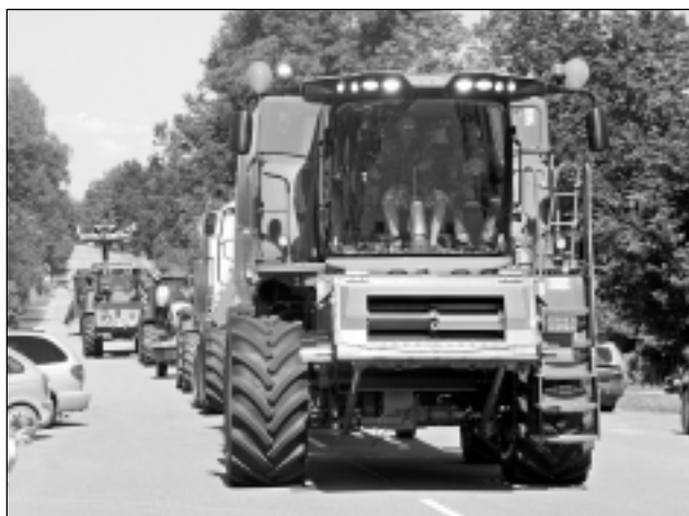
Smagās tehnikas parāde. Lauksaimniecības tehnikas parādē varēja apskatīt ne tikai mazus traktoros, bet arī monstrus – kombainus.