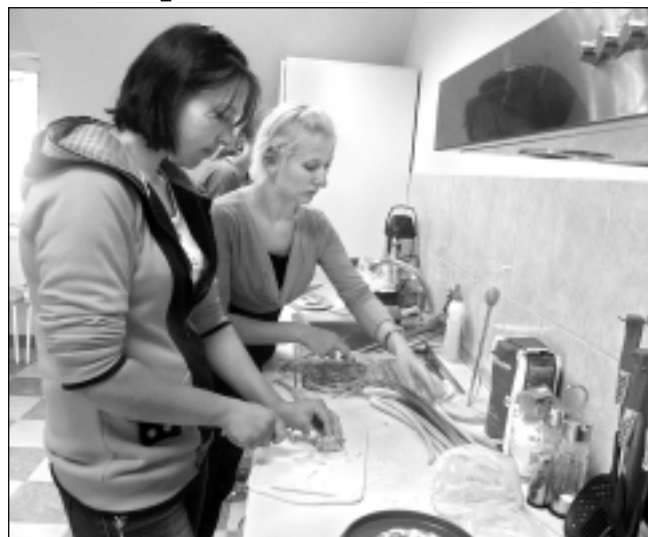
Gatavo ēdienu. Sociālās palīdzības projektā iesaistītās sievietes mācās gatavot ēdienu, kas ir svarīga prasme ikvienas sievietes dzīvē.

Jau pērn sociālās palīdzības sniegšanas projekta realizācijas laikā atbalsta centra darbinieki guva apstiprinājumu tam, ka iedzīvotāju dzīves kvalitāti var mainīt, mērķtiecīgi iedarbojoties uz apziņu, stiprinot un atbalstot sarežģītās dzīves situācijās. Tāpēc šī gada jaunais projekts ir iesāktā darba turpinājums. Tajā iesaistītas 30 no vardarbības cietušas personas (gan sievietes, gan vīrieši) un atbalsta centrā rehabilitāciju izejošo bērnu vecāki (13). No vardarbības cietušas personas "Rasas pērlis" dzīvo 30 dienas, saņemot 5 psihologa un 4 sociālā darbinieka konsultācijas katra. Centrā esošās sievietes piedalās sociālo audzinātāju piedāvātajās aktivitātēs: gatavo ēst, mācās dažādus rokdarbus, uzkopt mājokli, meklēt sev interesēm un spējam atbilstošu darbu, organizēt saturīgu brīvo laiku