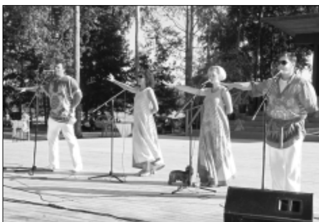
Ciemiņi. Nacionālā teātra aktieri klātesošos pārsteidza gan ar smalkiem jokiem, gan ar dziesmām dažādās valodās.