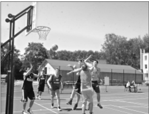
Sacensības basketbolisti. Rugāju novada svētki ļaužu atmiņās paliks kā iespēja izpausties dažādos veidos.