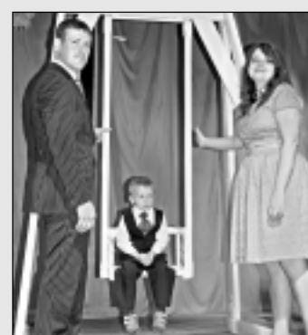
Bērības svētki Kubulos.