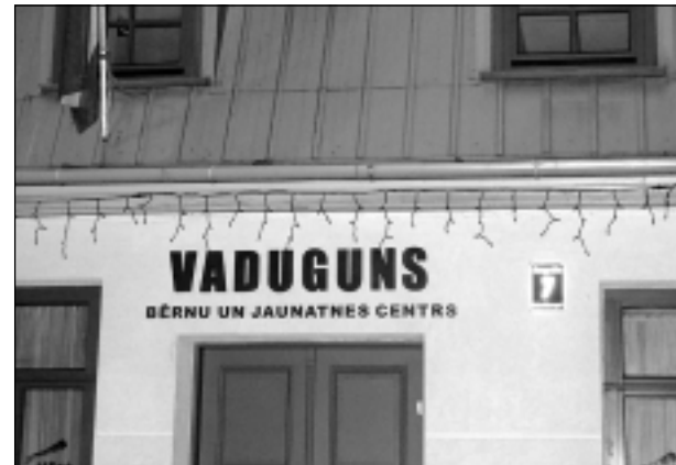
"Vaduguns" arī Liepājā. Iesūtīja Vineta Zeltkalne.