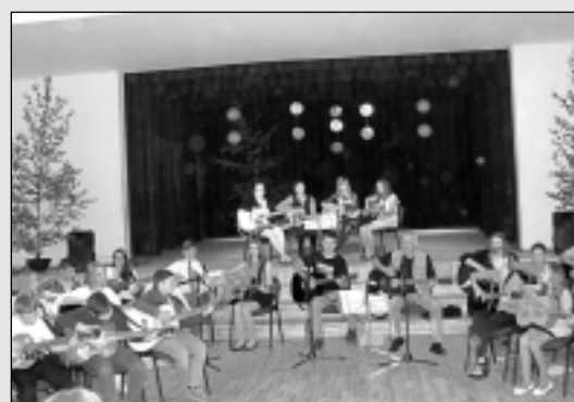
Koncertu sniedz pussimts ģitāristu.