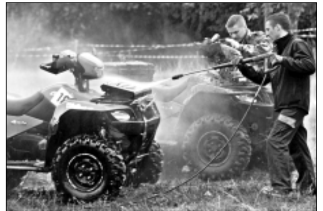
Lai tīrs! Pie "Silmaču" ūdens mucām un mazgātājiem veidojās pat rinda, īpaši pēc braucēju finiša, kad dažu spēkratu grūti atpazīt bija pat pašiem saimniekiem.