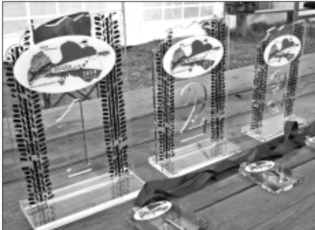
Kausi uzvarētājiem. Gulbenē SIA "Kopa" darinātie stikla kausi ar sacensību logo un medaļas, tāpat kā dāvanu kartes un citas balvas, pienācās uzvarētājiem.