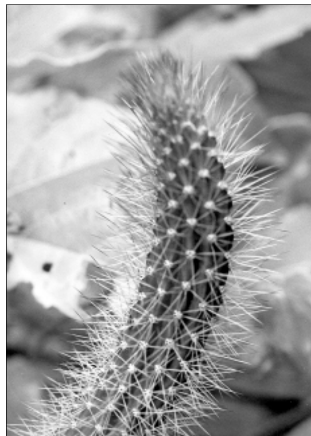
Bet man ir kuplāka bārda. Iesūtīja J.Kariks no Sidnejas.

Par jūnija veiksmīgākās fotogrāfijas autori atzīta VINETA ZELTKALNE ar fotogrāfiju "Vaduguns" arī Liepājā, kas publicēta 10.jūnijā. Pēc balvas griezties redakcijā.