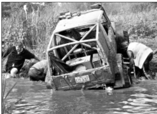
Palīgā! Kad nelīdzēja viņčas, trepes un citi palīglīdzekļi, auto mēģināja stumt, nebaidoties, ka būs pilnas acis ar dubļu šļakatām. Daudz līdzjutēju bija arī šai automašīnai, kura trasē devās ar neparastu nosaukumu - "Pīrādziņš".