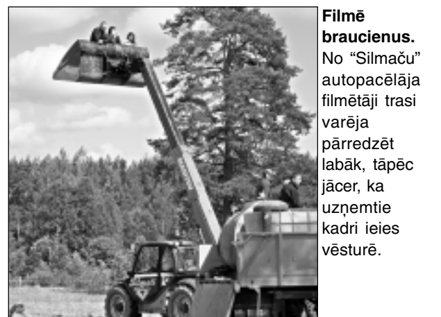
Filmē braucienus. No "Silmaču" autopacelēja filmētāji trasi varēja pārredzēt labāk, tāpēc jācer, ka uzņemtie kadri ieies vēsturē.