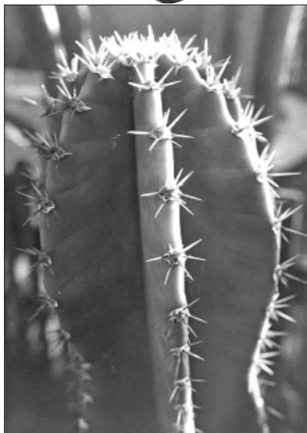
Man ir asa bārda.

Katra mēneša labākās fotogrāfijas autors saņems balvu. Fotogrāfijas var iesūtīt pa pastu – Balvi, Teātra ielā 8, LV-4501, vai elektroniski – vaduguns@apollo.lv. Pie foto obligāti norādāms vārds, uzvārds (vēlams - tālrunis).