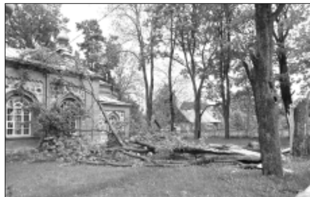
Aizķer jumtu. Baltinavā negaisa laikā kritošs koks aizķēra pareizticīgo baznīcas jumtu. Ne tikai Baltinavā, bet arī citviet mūspusē ir daudz vecu koku, kas nespēj pretoties vētrai.

No baznīcām, kur debesis slejas augstākie torņi, Balvu pusē zibens aizsardzības sistēma ierīkota vairākās, tostarp Šķilbēnu, Baltinavas, Balvu baznīcās. Zibensnovēdēju plānots ierīkot arī topošajā Balvu pareizticīgo baznīcā. No sabiedriskajām celtnēm zibens aizsardzības sistēmu BUB tagad ierīko topošajā lielveikalā "Maks" Viļakā un Rugāju sociālās aprūpes centrā, kas sabiedriskām ēkām ir obligāta prasība. No privātsaimniecībām pārskatāmā laika periodā sistēma uzstādīta Lazdukalna, Krišjāņu un Bērzpils pusē. "Uzņēmumam Krišjāņos prasījums uzstādīt zibens aizsardzības sistēmu izriet no būvnormatīviem, jo būvniecība top ar Eiropas Savienības finansējuma atbalstu, bet saimnieks izteica vēlmi, lai aizsardzības sistēmu uzstādītu arī dzīvojamā mājā. Tā jau ir viņa privātā darišana," saka M.Voicišs. Variānti zibens aizsardzības sistēmai ir vairāki, bet pamatā speciālisti piedāvā variantu, kas pasargā no tiešā zibens spēriena. Uzņēmums, kurš uzņemas veidot zibens aizsardzības sistēmu, to dara ciešā sadarbībā ar ēkas saimnieku, apsekojot ēkas apkārtni un pašu ēku. Uzstādot zibens aizsardzības sistēmu, galvenais ir uzstādīt to pareizi. "Ja to nevar pasūtīt speciālistiem, tad amatieriem pie šīs lietas labāk neķerties. Tad labāk, lai šīs sistēmas vispār nav," saka BUB valdes priekšsēdētājs.