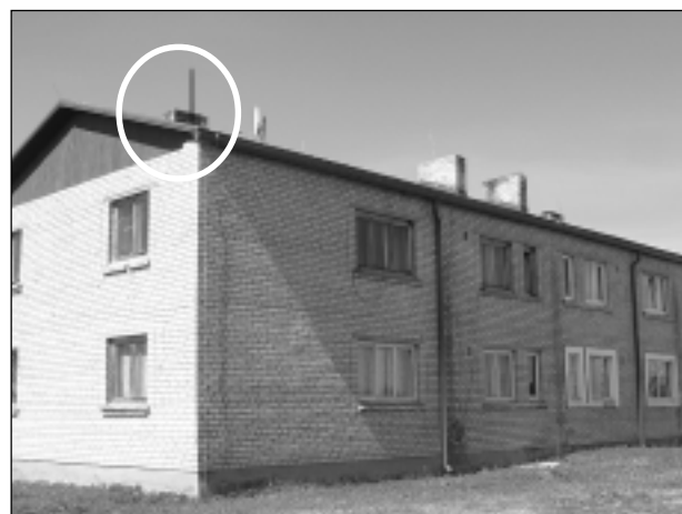
Ierīko zibensnovēdējus. Lai negaisa laikā justos droši, Rugāju novada Lazdukalna pagasta Skujetniekos divām daudzdzīvokļu mājām ar pašvaldības atbalstu ierīkoti zibensnovēdēji. Pirms dažiem gadiem Skujetniekos plosījās negaiss, nodarot pamatīgu postu.