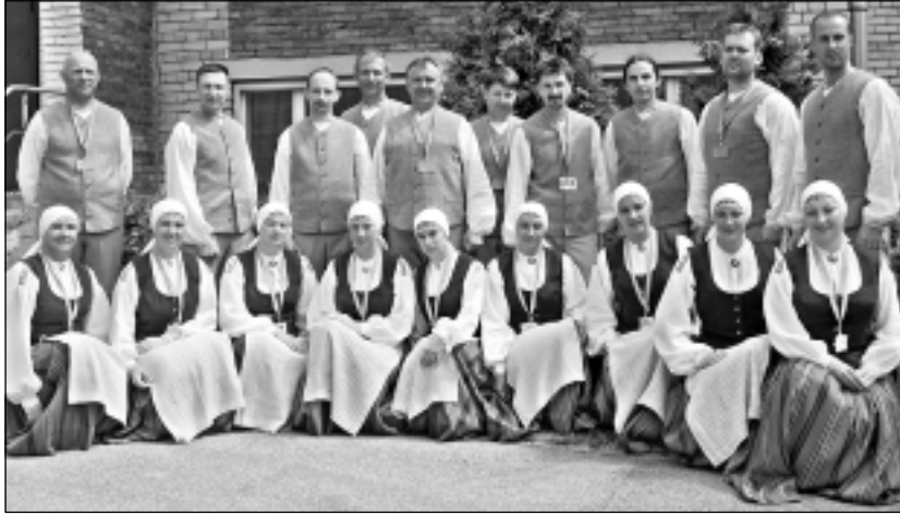
“Nebēdas” dejojāji. Viņiem no katra pasākuma ir pa atmiņu kamolam satīts, un svētki ir tā reize, kad kamoliņu atritināt un kopīgi izpriecāties.