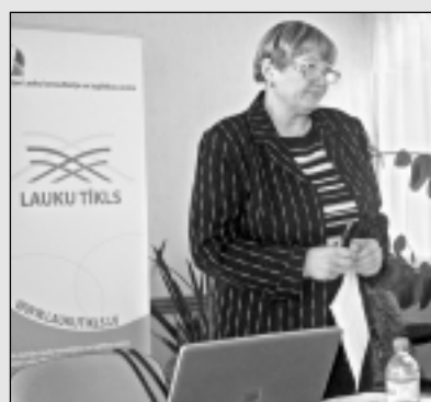
Seminārs lauku uzņēmējiem Balvos.