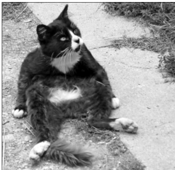
Nav ko brīnīties - arī kaķis var pasēdēt pēc garas darba dienas!

Katra mēneša labākās fotogrāfijas autors saņems balvu. Fotogrāfijas var iesūtīt pa pastu – Balvi, Teātra ielā 8, LV-4501, vai elektroniski – vaduguns@apollo.lv. Pie foto obligāti norādāms vārds, uzvārds (vēlams - tālrunis).