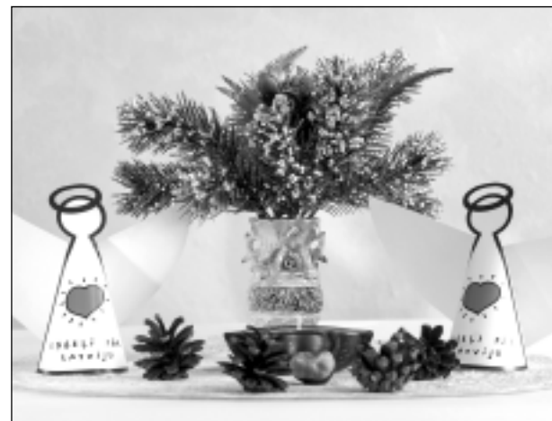
Tuvojas Ziemassvētki.

Par novembra veiksmīgākās fotogrāfijas autori atzīta BRIGITA LANGOVSKA ar fotogrāfiju "Nav ko brīnīties - arī kaķis var pasēdēt pēc garas darba dienas!", kas publicēta 28.novembrī. Pēc balvas griezties redakcijā.