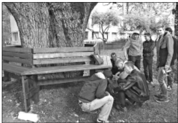
Uzstāda soliņu. Pirms muzeja atklāšanas Lāča dārzā notika akcija un talka “Saglabāsim dižozolu!”. Jāpiebilst, ka jau no agra rīta Lāča dārzā aktīvi strādāja Balvu profesionālās un vispārīgizglītojošās vidusskolas audzēkņi, kuri ap dižozolu izveidoja sešstūra soliņu.