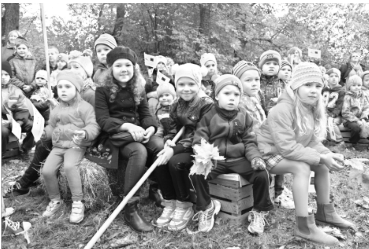
Pie dižozola. Eiropas sadarbības dienas pasākumā neizpalika ne dziesmas, ne dejas, ne rotaļas. Ar lielu interesi notiekošajā raudzījās bērnu dārza audzēkņi (foto), kuri ikdienā sastopas ar Balvu varenāko koku – dižozolu.