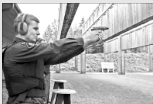
Panākums robežsargu sacensībās.