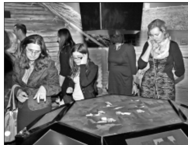
Tas ir interesanti! Balvu Novada muzejs tagad pārsteidz ar dažādiem multimedijiem un inovatīvām tehnoloģijām. Muzeja darbinieki nešaubās, ka tās īpaši uzrunās arī bērnus un jauniešus, jo vēsturē tagad var ielūkoties, arī izspēlējot dažādas spēles.