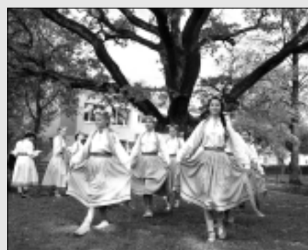
Svētki Lāča dārzā un Balvu Novada muzejā.