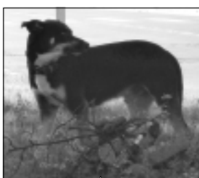
Attēlā redzamais suns brīvi kļīst Balvos, Brīvības ielas krustojumā.