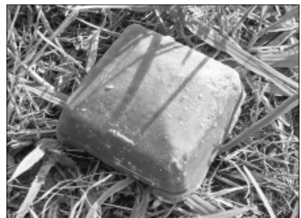
Vakcīna - brūngans kubiņš, nedaudz mazāks par sērkokociņu kastīti.

Jāatgādina, ka trakumsērga ir bīstama, neārstējama dzīvnieku un cilvēku veselību un dzīvību apdraudoša infekcijas slimība. Trakumsērgas rezervuārs dabā ir savvaļas dzīvnieki, galvenokārt - lapsas un jēnotsuņi. Mājdzīvnieki, visbiežāk nevakcinēti suņi un kaķi, ar trakumsērgu inficējas pēc kontaktēšanās ar slimiem savvaļas dzīvniekiem. Vienīgais efektīvais trakumsērgas profilakses pasākums ir savlaicīga un regulāra dzīvnieku vakcinācija pret trakumsērgu.