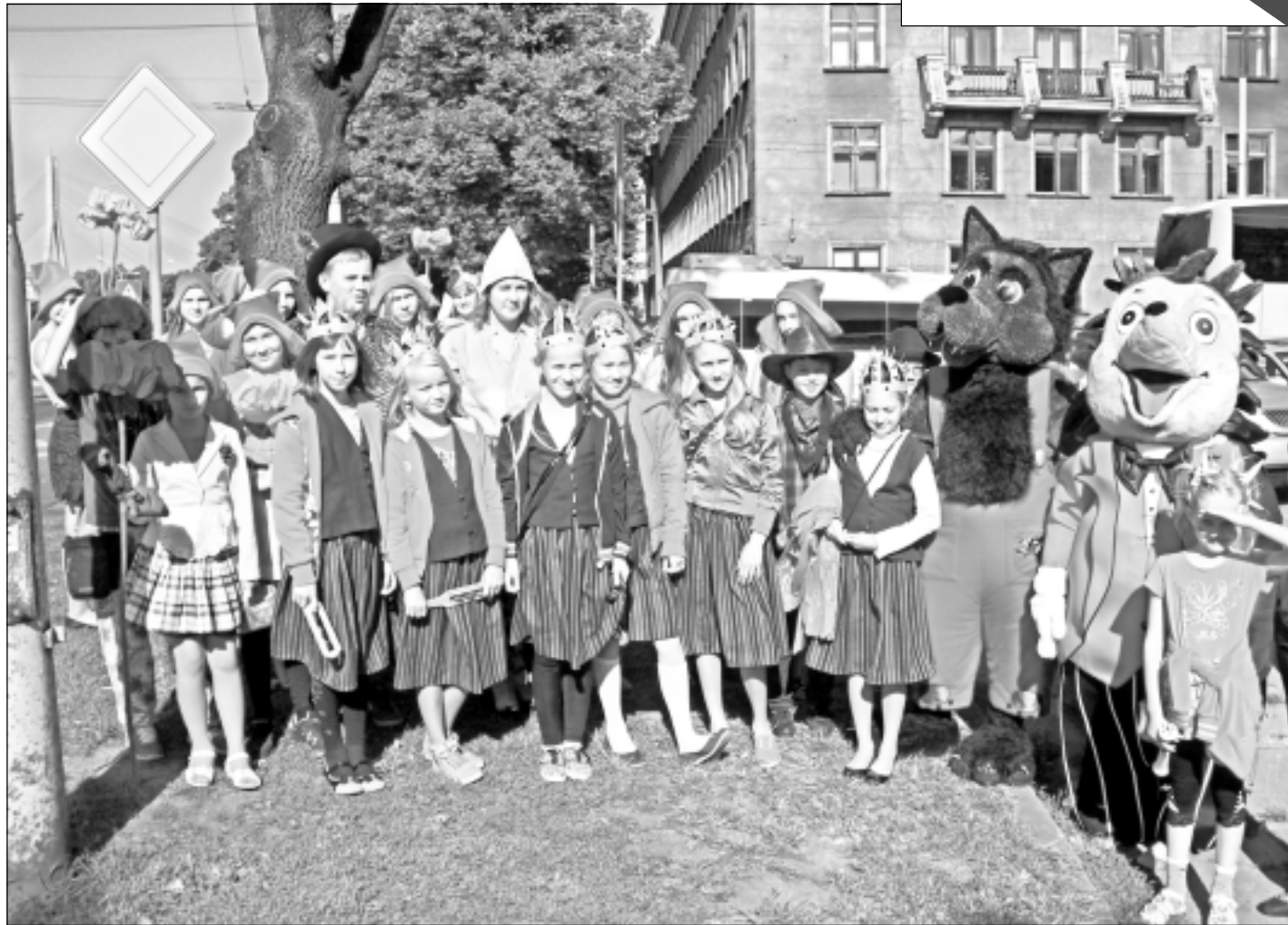
Galvaspilsētā. Mūspuses skolēni braucieni uz Gaismas pili vērtē kā vērtīgu un izzinošu. "Mēs patiešām guvām spilgtus un neaizmirstamus iespaidus," viņi priecājas.

14.septembrī plkst. 11.30 Balkanos notiks Viļakas novada čempionāts riteņbraukšanā. Distanču garumi no 7 līdz 25 kilometriem, dalījums vecuma grupās.