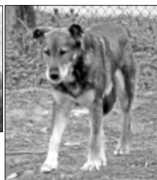
Attēlā redzamais suns brīvi kļīst pilsētā.

Lūdzam sniegt jebkādu informāciju par šo suņu saimniekiem. Zvanīt pa tālr. 29113054.