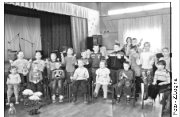
Dziesmu papildina ar žestiem. Medņevas pamatskolas skolēni izpildīja dziesmu, kuras piedziedājumu papildināja ar žestiem.