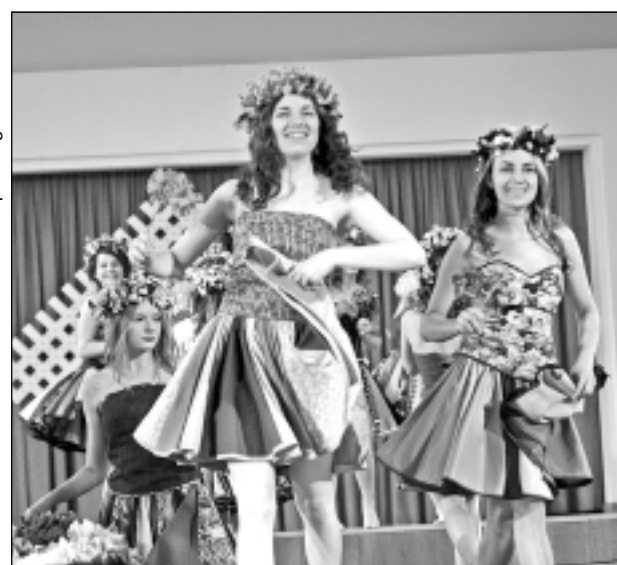
Ligo. Kā top vainadziņi, kas rotā meiteņu galvas, demonstrējot šo kolekciju, drīzumā varēsiet izlasīt jauniesu žurnālā “Avene”.