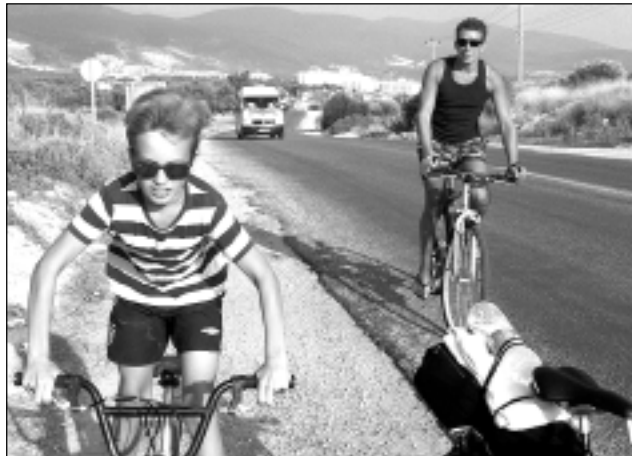
Var atpūsties arī tā. Neliels izbrauciens ar velosipēdiem uz 15km attālo Akbuk kūrortpilsētiņu, kas vairāk atgādina zvejniekciemu.