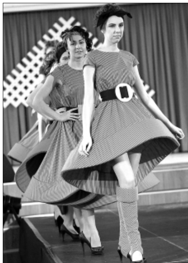
“Nāc līdzī”. Šī kolekcija izpelnījās ne tikai 1.pakāpi, bet arī visaugstāko punktu skaitu – 29,9 no 30 iespējamiem.