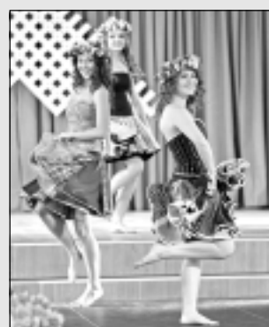
Triumfē reģionālajā dziesmu svētku atlasē skatē.