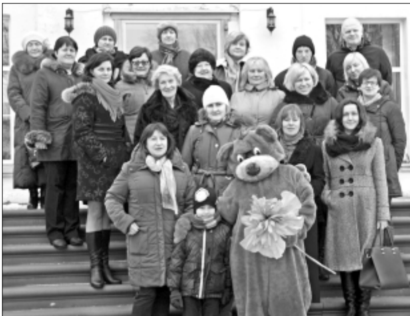
Seminārā Balvos. Projekta dalībnieki pēc izziņošanas semināra Balvu muižā nofotografējās kopā ar Balvu lāci.

Trīs dienu apmācību kursu "Trešo valstu valstspiederīgais-institūciju klients" no 25. līdz 27.martam atpūtas kompleksā "Laimis Līgzda" Drabešu pagasta Amatas novadā apmeklēja arī biedrības "Ritineitis" pārstāves no