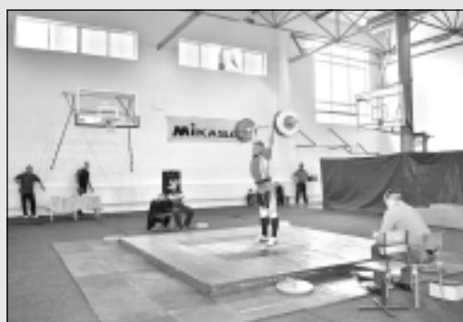
Aizvada Kirjanova piemiņas turnīru.