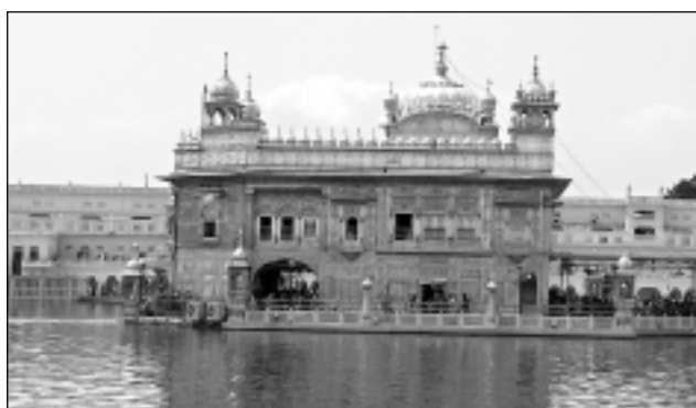
Zelta templis atrodas Amritsarā. Tā ir sikhisma garīgā galvaspilsēta. Templis atrodas uz salas un to ieskauj Nektāra ezers. Šeit bijām gan naktī, gan dienā, vērojām, kā cilvēku simti gatavo ēdienu un pabaro tūkstošiem svētceļnieku.