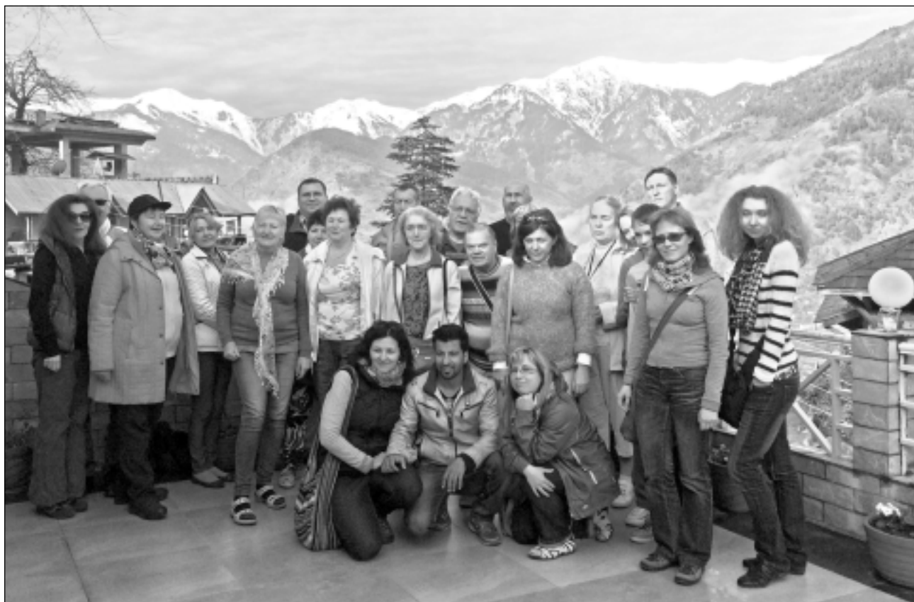
Sajūta kā padebešos. Ceļotāju grupa Himalaju jeb Pasaules jumta priekškalnēs baudīja gan ziedošos dārzus ielejās, gan sniegoto kalnu varenību.