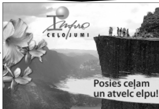
Brīvbrīdi sagatavoja Z.Logina