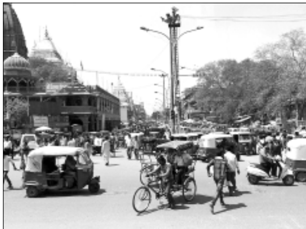
Haoss ielās. Tas, kas notiek uz ielām, izskatās pēc liela haosa. Tomēr, vērojot braucējus, secinājām, ka tur valda tikai viņiem vien zināma un izprotama kārtība. Līdzās mašīnām un motorolleriem vietu atrod gan tirgonis ar savu tačku , gan govīs, sunī, rikšās, gan gājēji, kuri mēģina šķērsot ceļu, paceļot roku pret braucēju.