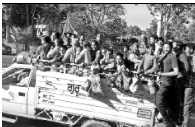
Smaidīgi un laimīgi. Šādi skati bija pierasti, jo indieši pārvietojas ar jebkuru transportu un nedomā, drīkst vai nedrīkst kāpt, piemēram, uz braucamrīka jumta.