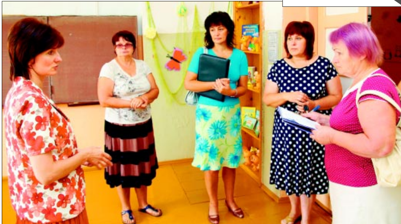
Priecājas par paveikto. Balvu novada pašvaldības Izglītības, kultūras un sporta pārvaldes speciālistes neslēpa prieku par paveikto mūspuses skolās: “Apbēdina tikai tas, ka visā valstī sarūk skolēnu skaits.”

Arī 2016.gadā laikraksta “Vaduguns” kolektīvs plāno sarūpēt dāvanu lasītājiem – sienas krāsaino pārlietamo kalendāru “Vaduguns 2016”. Aicinām uzņēmējus uz sadarbību – Jums ir vienreizēja iespēja ievietot bildi un reklāmu par savu uzņēmumu un sniegtajiem pakalpojumiem kalendārā, izvēloties konkrētu mēnesi. Tas nozīmē, ka mēnesi par piedāvātajiem pakalpojumiem atgādinās vairāki tūkstoši kalendāru mūspuses lasītāju mājās. Tālrunis informācijai 64507019.