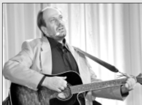
Dzejas pasākums Kubulos.