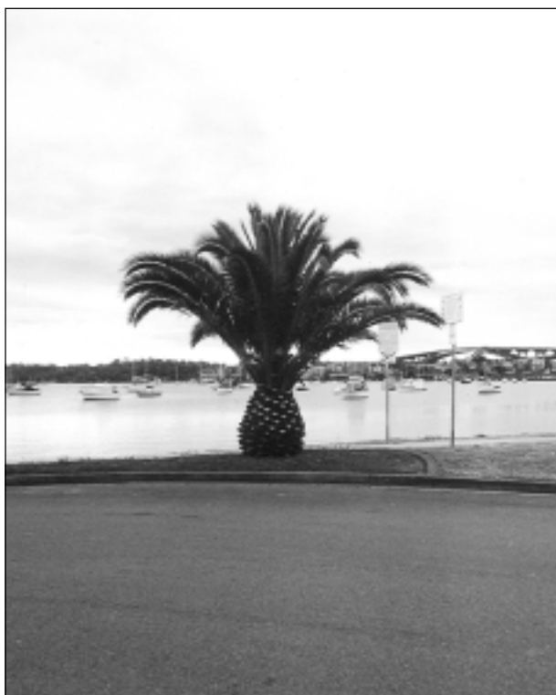
Puķu vāze upmalā.

Katra mēneša labākās fotogrāfijas autors saņems balvu. Fotogrāfijas var iesūtīt pa pastu - Balvi, Teātra ielā 8, LV-4501, vai elektroniski - vaduguns@apollo.lv. Pie foto obligāti norādāms vārds, uzvārds (vēlams - tālrunis).