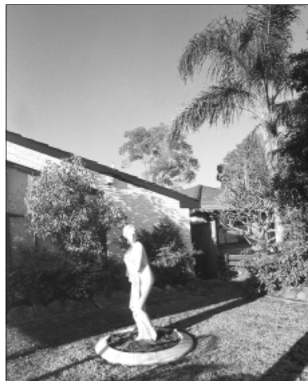
O, piedodiet! Iesūtīja J.Kariks no Austrālijas.