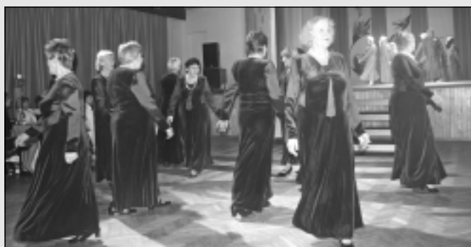
"Teiku un pasaku karnevālā".