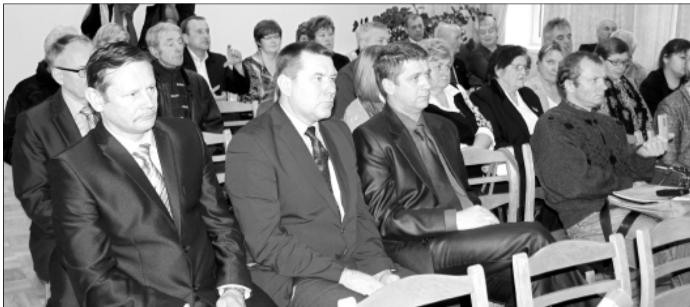
Klausās un domā līdzī. Iespēju tikties ar zemkopības ministru izmantoja pašvaldību pārstāvji un lauku uzņēmēji.

Lai varētu izdzīvot, piensaimnieki papildus savai nozarei kopā saņēmuši vairāk par 39 miljoniem eiro. "Taču nevar būt tā, ka pēc