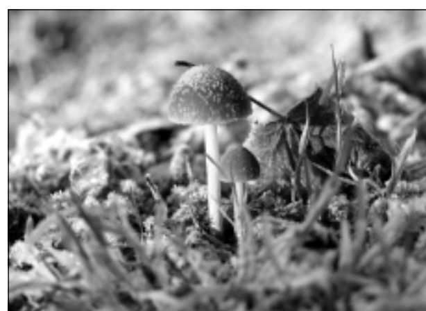
Lappusi sagatavoja E.Gabranovs