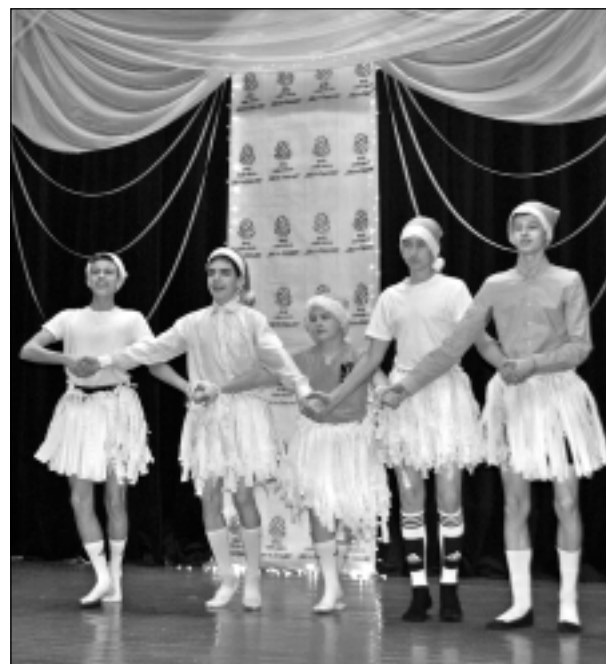
Mazo gulbišu dejas. Viens no jautrākajiem priekšnesumiem, ko skatītāji sveica ar skaļām ovācijām, bija 8.b klases zēnu dejas.