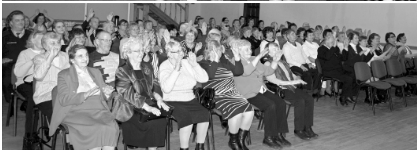
"Mazu brīdi pirms gaismiņas". Skaistu svētku mirkli Balvu pilsētas senioriem sagādāja Balvu Profesionālās un vispārīzglītojošās vidusskolas skolēni un skolotāji.