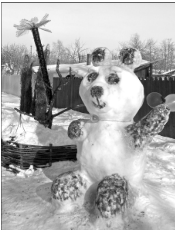
Sniega panda. Autore – Svetlana Duļko.