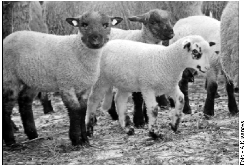
Ganāmpulka papildinājums. Mazie jēri ļoti jāšargā no lapsām, ienaidnieki viņiem ir arī jēnoti.

izlietojuši, nopakojot kūtsaugšu. Taču tagad atzīst, ka tā nevajadzējis darīt, jo vilna ir higroskopiska, tāpēc pievelk mitrumu.