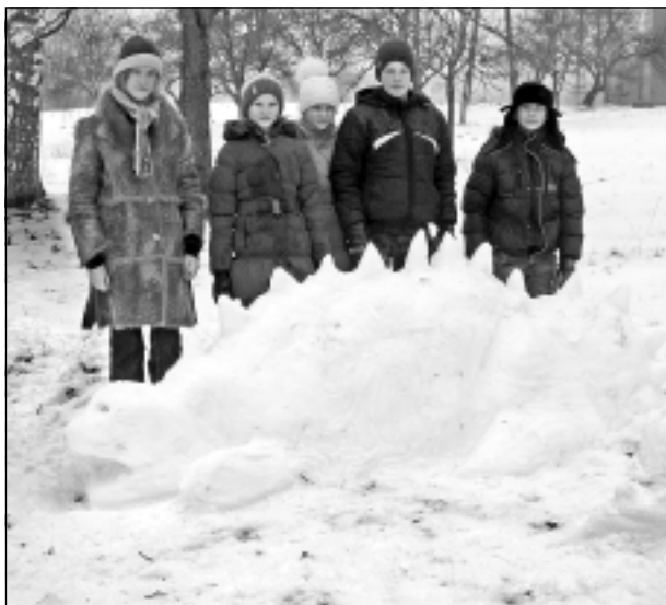
Vai tas ir pūķis? Bērziņu vidusskolas Krišjāņu filiāles 6.-8.klases skolēni savu autordarbu nosauca par drakonu.