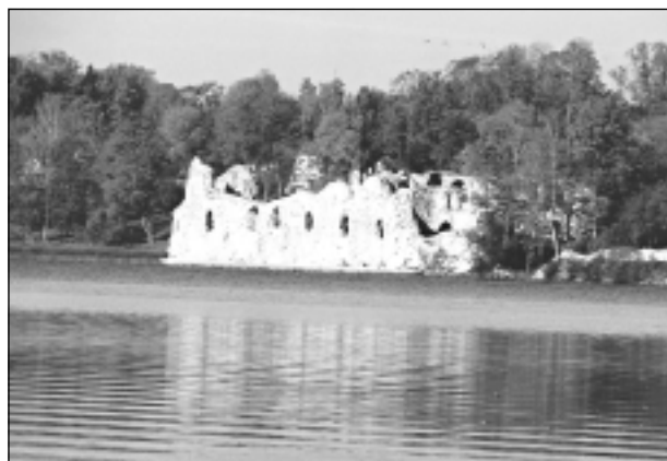
Likteņdārzā. Iesūtīja Daniels Kivkucāns no Balviem.

Katra mēneša labākās fotogrāfijas autors saņems balvu. Fotogrāfijas var iesūtīt pa pastu – Balvi, Teātra ielā 8, LV-4501, vai elektroniski – vaduguns@apollo.lv. Pie foto obligāti norādāms vārds, uzvārds (vēlams - tālrunis).