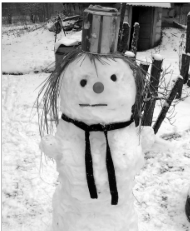
Sniega dāma!