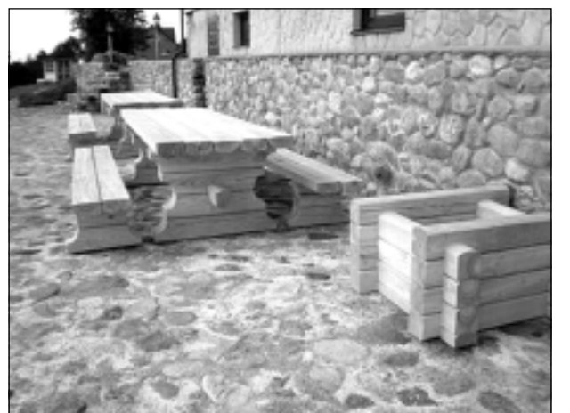
Ezera piekrastē. Vasarā, protams, šī apkārtnē ir vispievilcīgākā. Tad ir īstais laiks baudīt atpūtu un priecāties par cilvēku darbu, kuri prot iekārtot skaistu vidi.