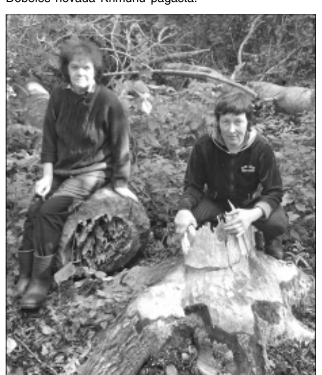
Bioloģiskā zāģa darbs. Lappusi sagatavoja E. Gabranovs