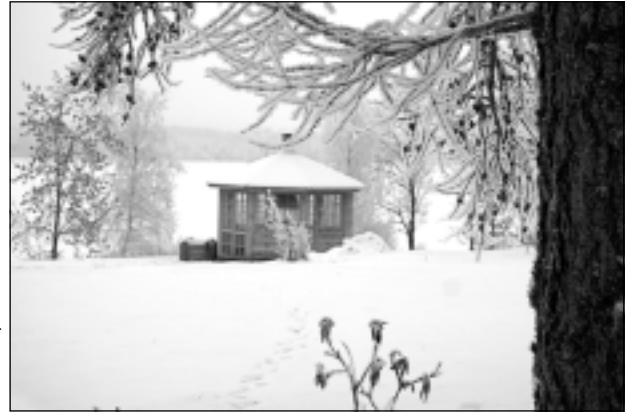
Sniegotā dienā. Tik skaisti, ka nenoskatīties!