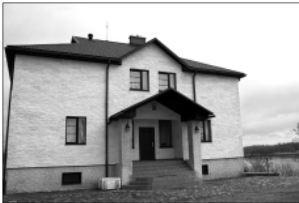
Nams ezera krastā. Jaunajai uzņēmuma administratorei ir savs redzējums, kas varētu notikt lielajā, skaistajā namā, lai tas nestu atdevi.