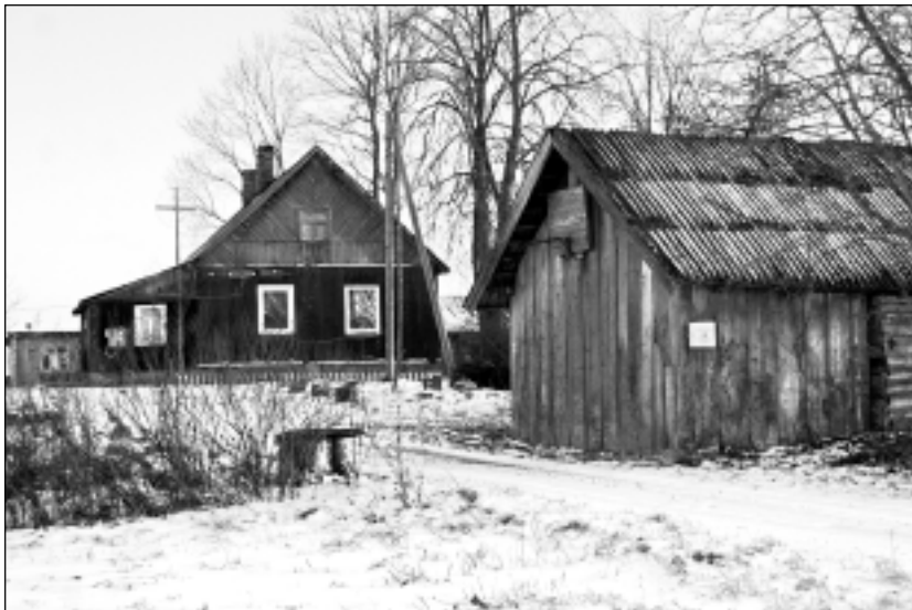
Slepkavības vieta. Noziegums tika pastrādāts attēlā redzamajā mājā Briežuciema pagasta Cērpenē.