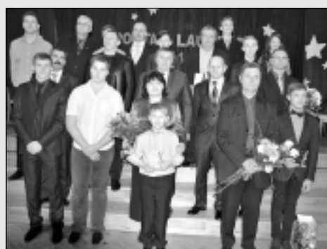
2014. gada sporta laureāti Balvu novadā.