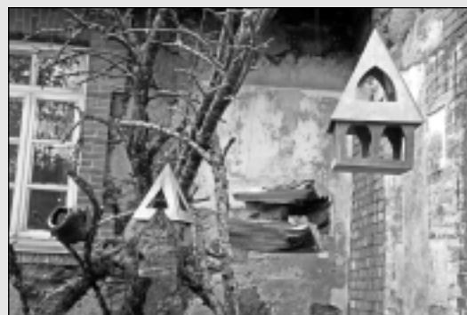
Interesantas putnu barotavas.