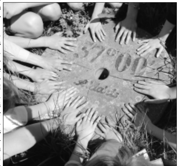
57. paralēle. Skolēnu rokas uz "Aldara" uzstādītās 57.paralēles zīmes Baltinava novada Zelčos.