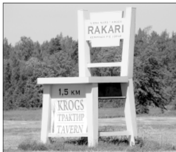
Piesaista uzmanību. Koši dzeltenie krēsli labi redzami jau pa gabalu un izraisa garābraucēju interesi.

Šķērsojot Salacgrīvas novadu pa automaģistrāli "Via Baltica", uzmanību piesaista vairāki milzīgi krēsli, kas novietoti abpus šosejai dažādos attālumos viens no otra. Ieraugot tādu sēdekli, neviļus sajūties kā Sprīdītis vai liliputs. Krēsli ir teju dzīvojamās mājas augstumā, un uzkāpt, lai apšētos tādā, var, tikai izmantojot trepes. Uzraksti uz krēsliem liecina, kas tas ir viesu nama "Rakari" reklāmas stends. Re, ko izdomājuši, rakari, tādi!