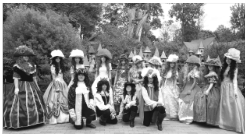
Iejūtas 18. - 19.gadsimta noskaņās. Skolēni un skolotājas - galma dāmas, princeses un prinči "Miniatūrajā karaļvalstī" Preiļos.

Kā pēdējais apskates objekts ekskursijas maršrutā bija Franča Trasuna muzejs "Kolnasāta". Diena bija informācijas piesātināta, skolēni vakarpusē noguruši, taču muzeja darbinieces bija parūpējušas par atraktīvu izzinošu spēli. Tās laikā skolēni ne tikai izkustējās, bet arī ieguva informāciju par šo izcilo Latgales Atmodas darbinieku, garīdznieku, valstsvīru, rakstnieku un publicistu. Ekskursijas noslēgumā