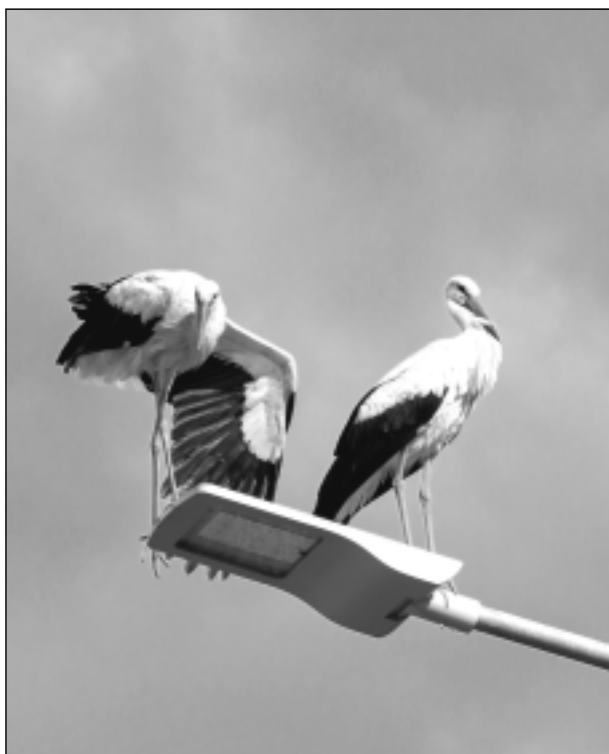
Kas tur apakšā? Iesūtīja Juris Kašs no Balviem.

Katra mēneša labākās fotogrāfijas autors saņems balvu. Fotogrāfijas var iesūtīt pa pastu – Balvi, Teātra ielā 8, LV-4501, vai elektroniski – vaduguns@apollo.lv. Pie foto obligāti norādāms vārds, uzvārds (vēlams - tālrunis).