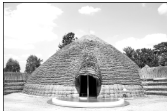
Ruandas karaļa pils. Pirms misionāru ierašanās Ruandā valdīja karalis, kura pils tagad kalpo kā apskates objekts.