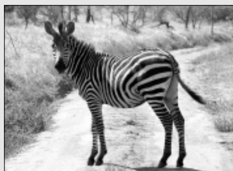
Zebra Akageras dabas parkā.