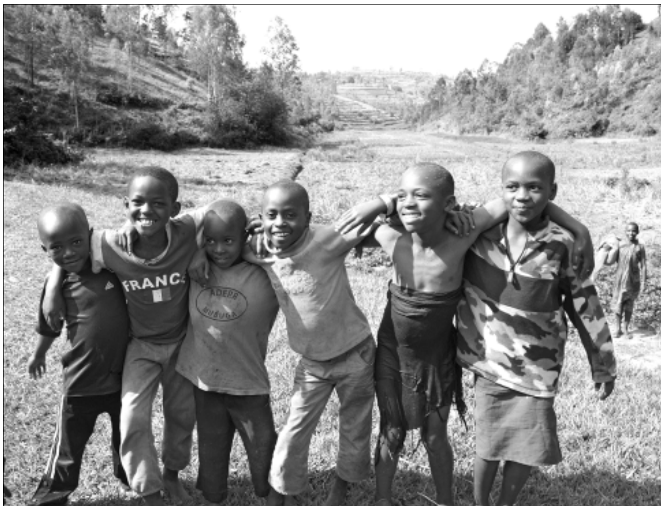
Ruandas bērni. Taisnība teicienam, ka bērni visā pasaulē vienādi, it sevišķi laukos, kur tie bieži vien ir pieticīgi ģerbusies, mazliet nosmulējušies, bet dzīvespriecīgi un ziņkāriģi. Labprāt fotografējas. Tādi ir arī Ruandas bērni.