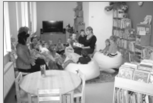
Bērnu grāmatu nedēļa Balvu Centrālajā bibliotēkā.