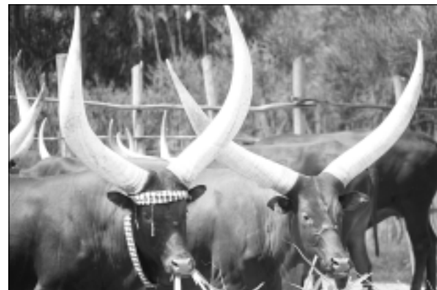
Karaliskās govīs. Ruandas iedzīvotāji, kuri nodarbojas ar lopkopību, audzē govīs, kuras sauc par karaliskajām govīm. Ragi tām patiesi ir karaliski.