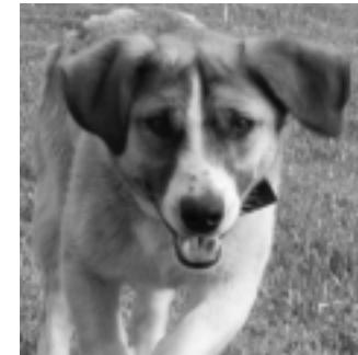
Dāvina neliela auguma 10 mēnešus vecu sunīti. Tālr. 27545491.

Meklē saimniekus kaķiem. Visi kaķi ir sterilizēti, čipoti, attārpoti. Lūgums zvanīt pa tālr. 27879125 vai 28315374.