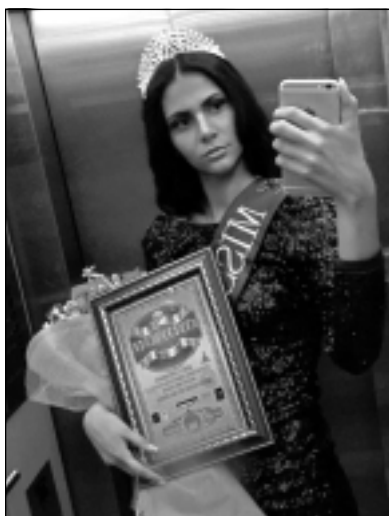
Turcija. Alises selfijs, kas tapis pēc pusfināla jeb dienu pirms fināla.

-Maigi izsakoties - jā! Kā jau iepriekš minēju, negāciju ir ļoti daudz. Tomēr, lai cik ļoti censtos, esmu sapratusi, ka visiem labi tik un tā nebūs nekad. Ir jāsaprot, ko gribu pati, un jāiet uz to! To arī novēlu visiem lasītājiem!