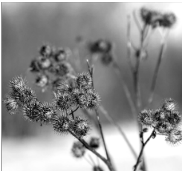
Klusā daba.

Katra mēneša labākās fotogrāfijas autors saņems balvu. Fotogrāfijas var iesūtīt pa pastu – Balvi, Teātra ielā 8, LV-4501, vai elektroniski – vaduguns@apollo.lv . Pie foto obligāti norādāms vārds, uzvārds (vēlams - tālrunis).