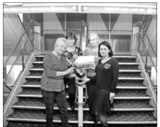
Nopelnām šampanieti un šokolādi. Uz kuģa vakara šova programmā sveic visus, kuri tajā dienā svin dzimšanas, vārdadienas vai citus svētkus. Arī vadugunieši 65.jubilejā saņēma pārsteigumu no kuģa komandas - lielu šampanieša pudeli un šokolādes kārbu.