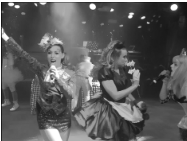
Plašas izklaides un atpūtas iespējas ikvienai gaumei. Bārī un naktsklubī, karaokē, dzīvā deju mūzika starptautisku ansambļu izpildījumā un krāšņās vakara šova programmas - ar to slaveni ceļojumi ar kruīza kuģiem. Šoreiz uz "Isabelle" astotā klāja mūs gaidīja šova deju grupa no Lielbritānijas un Latvijas vingrotāju šovs, kurā bija apvienoti sporta un deju elementi.