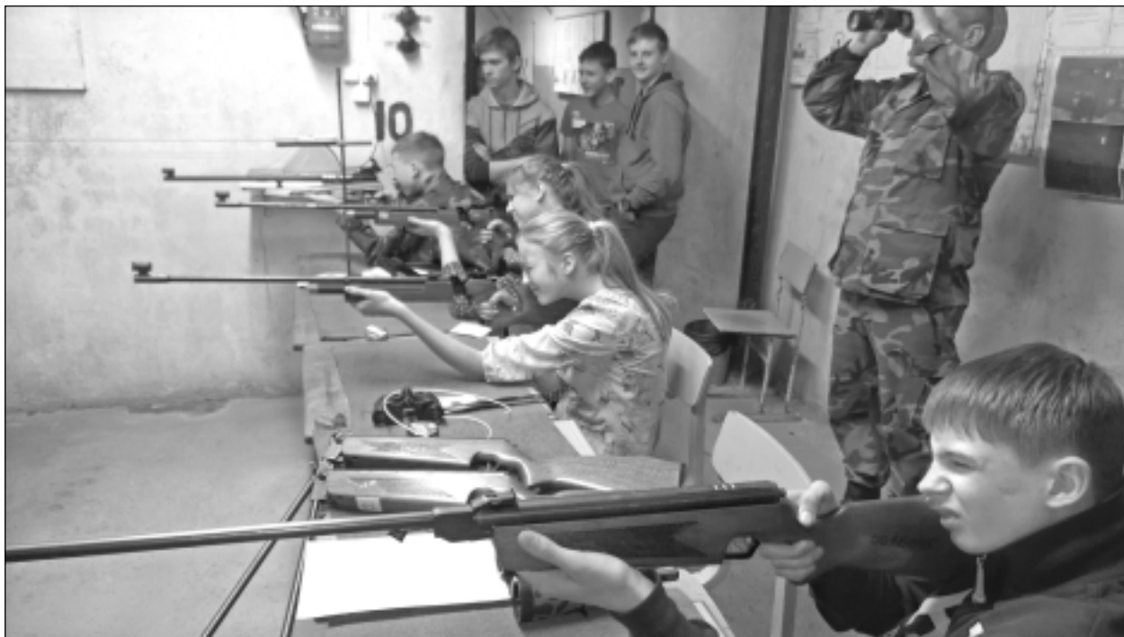
Sacensību karstumā. Jaunsargi šaušanas sacensībās šāva no 10 un 50 metru attālas distancēs.

10.martā Viļakā notika Rekrutēšanas un Jaunsardzes centra Jaunsardzes departamenta 2.novada nodaļas Viļakas, 301.Balvu, 302.Tilžas, 303.Kārsavas, 304.Ludzas un 317.Zilupes jaunsargu vienību kausa izcīņas sacensības ložu šaušanā.