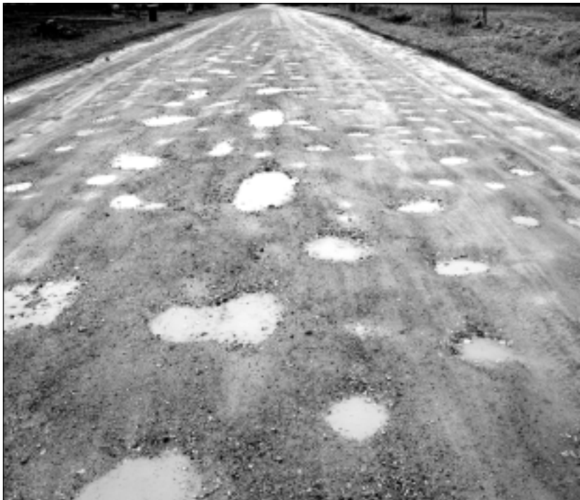
Tirās mocības. Tagad, pavasarī, vietējais valsts nozīmes ceļš posmā Pāliņi-Gailiši vietējiem iedzīvotājiem sagādā pamatīgas galvassāpes. Ik dienas te jābrauc uzņēmējiem, zemniekiem, skolēnu autobusam.