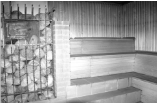
Sauna. Populāra apmeklētāju vidū ir arī jaunā sauna, kurā var uzņemt tādu garu, kā āda sviļst.