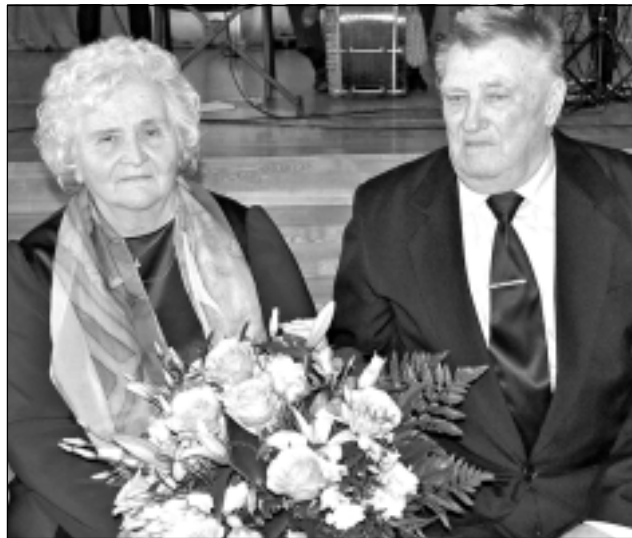
Pēc 54 gadiem. Bērni sarūpēja skaistu dāvanu - jubileju, par ko miļš paldies. Pateicības vārdus viņi sūta ikvienam labajam gariņam, kas darbos un domās šajā dienā bija kopā ar viņiem.