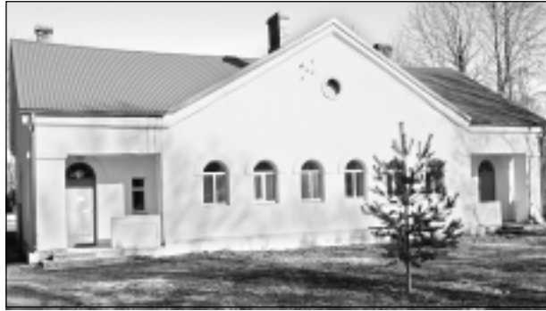
Pirts ārskats. Publiskā pirts tagad var lepoties ne tikai ar higiēnas un estētiskām prasībām atbilstošām modernām iekštelpām, bet arī nosiltinātām ārsienām, jaunu jumtu, hermētiskiem logiem un modernu apkures sistēmu.