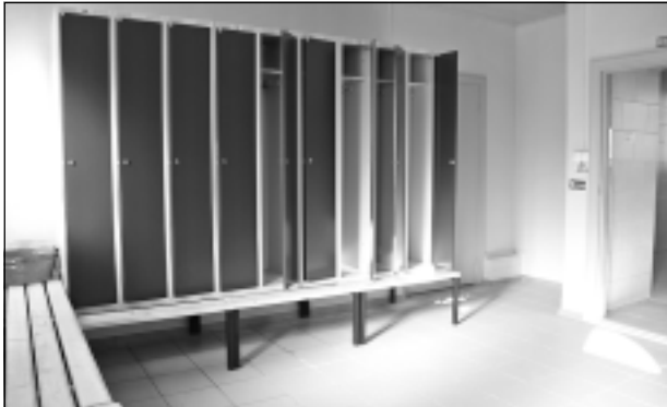
Ģērbtuves. Savas drēbes apmeklētāji var atstāt jaunus aizslēdzamos skapišos.

ir sava pirts un dīķis,” apgalvoja sieviete. Viņa sprieda, ka daudziem citiem viļacēniem ir līdzīga situācija, tāpēc zudusi vajadzība pēc sabiedriskās pirts apmeklējumiem.