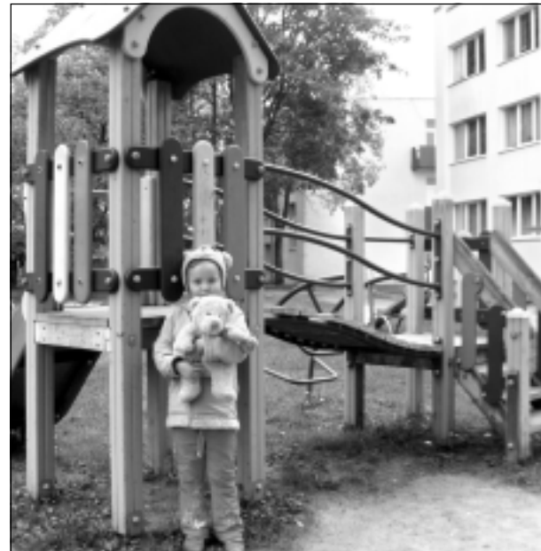
Madara. Iesūtīja Leontīna Dukaļska no Balviem.