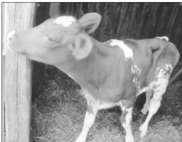
Kas tur ir? Iesūtīja Daniels Kivkucāns no Balviem.

Katra mēneša labākās fotogrāfijas autors saņems balvu. Fotogrāfijas var iesūtīt pa pastu – Balvi, Teātra ielā 8, LV-4501, vai elektroniski – vaduguns@apollo.lv. Pie foto obligāti norādāms vārds, uzvārds (vēlams - tālrunis).