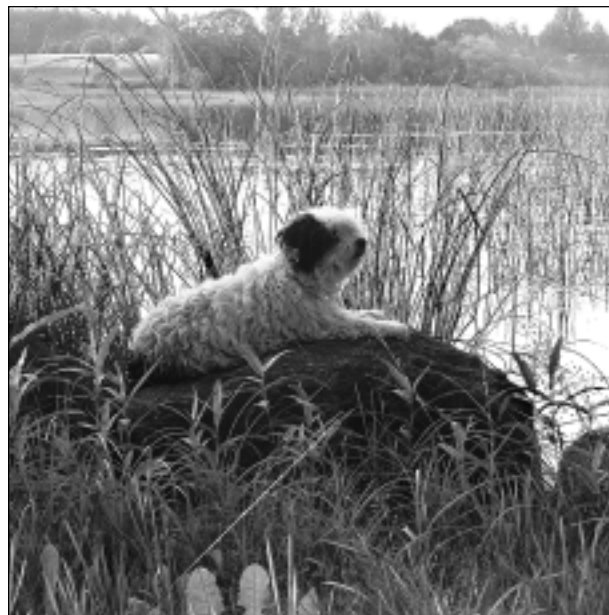
Ezera krastā.