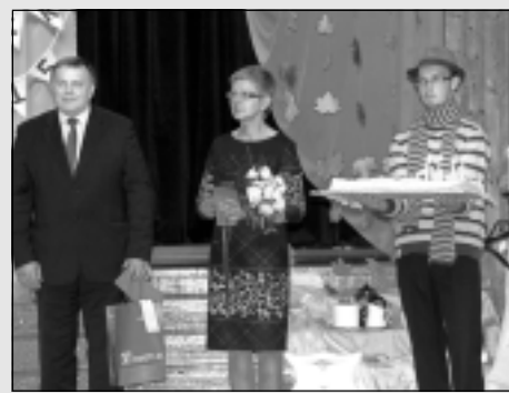
Aizvada Grāmatu svētkus.