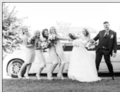
Pusnaktī kronēja par karali un karalieni...