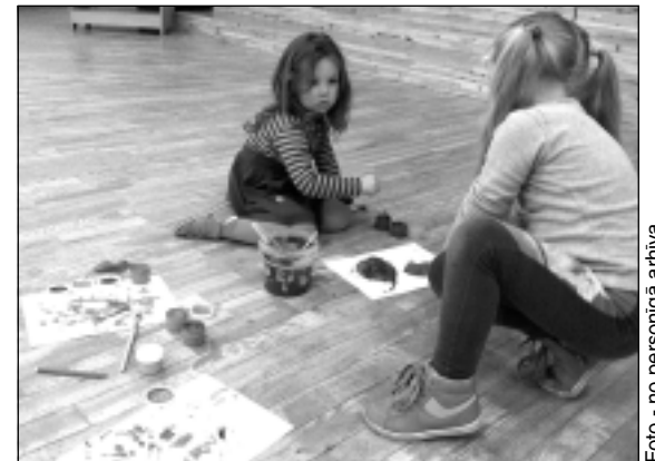
Izkrāso lapas. Bērnu ballītes dalībnieces izkrāsoja lapas rudens kokam, kur varēja ļauties gan fantāzijai, gan dabā redzētajam.