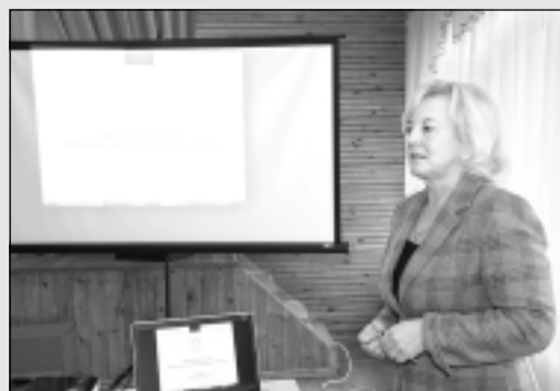
Viļakā notiek seminārs par uzņēmējdarbības iespējām.