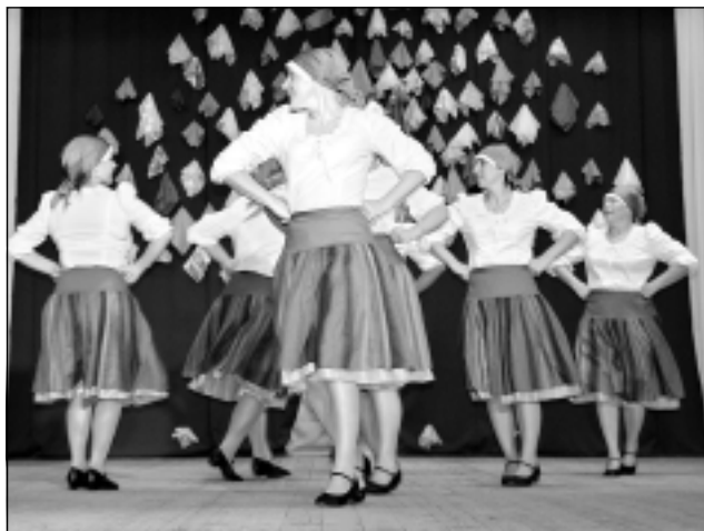
"Asjate". Bērzipilietes uz Baltinavu devās ar prieku, jo bija iespēja redzēt, kā uzstājas dejotājas no citiem novadiem.