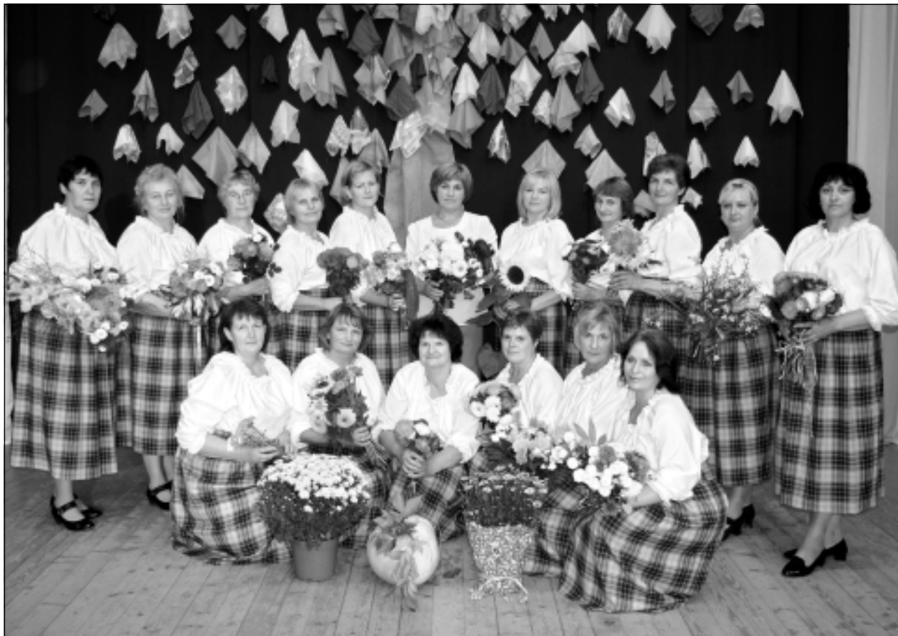
Baltinavas deju kopa "Gaspāža". Kolektīvā deju 16 sievietes, un šovasar viņas, gatavojoties Starptautiskajam Eiropas deju festivālam Gaigalavā, uzsuva jaunus tērpus. Koncertā "Gaspāža" uz skatuves kāpa trīs dažādos tērpos.