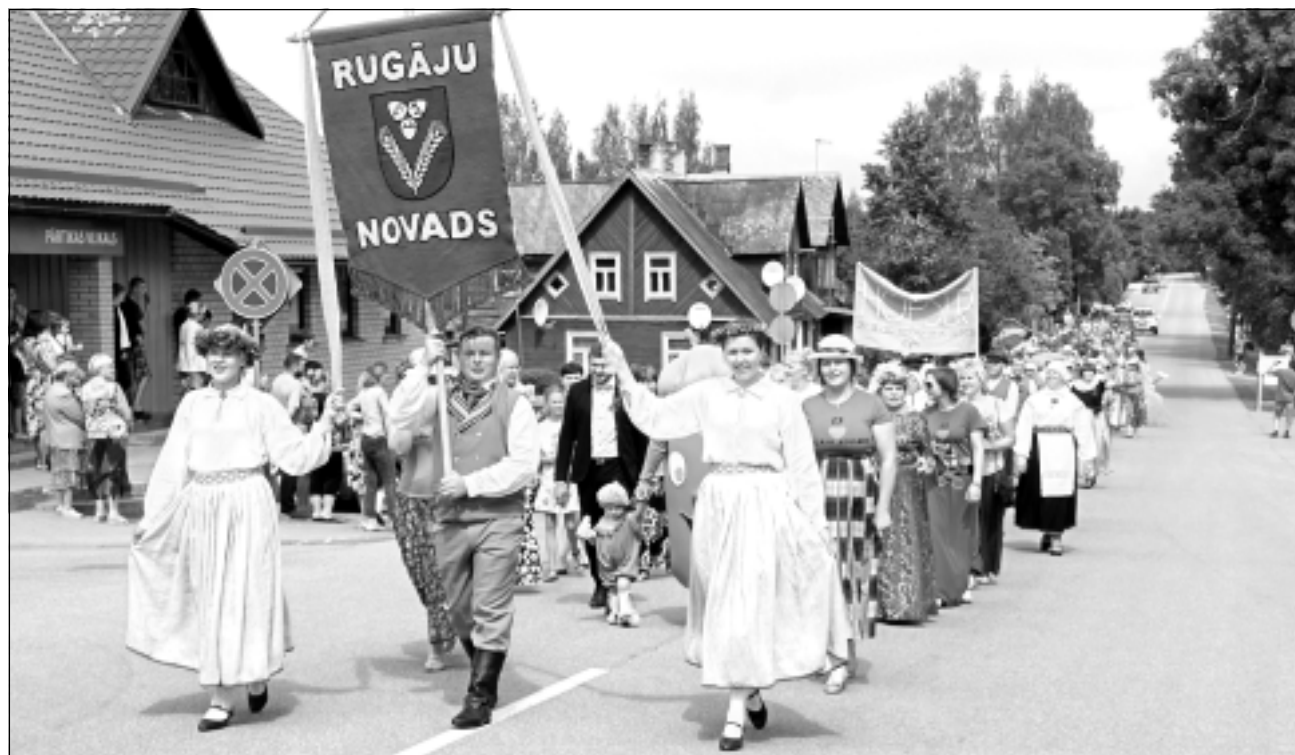
Gājiens. Tajā devās Rugāju novada ļaudis, kā arī ciemiņi no Igaunijas.