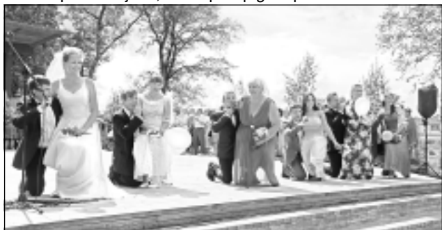
Skrejošās līgavas un bēgošie līgavaiņi. Izrādās, dramatiskā kolektīva "Zibšņi" puīši ir veikli operdziedātāji. Kāpēc veikli? Viņu balsis bija pārvērtušās līdz nepazīšanai, turklāt tajā labākajā nozīmē.