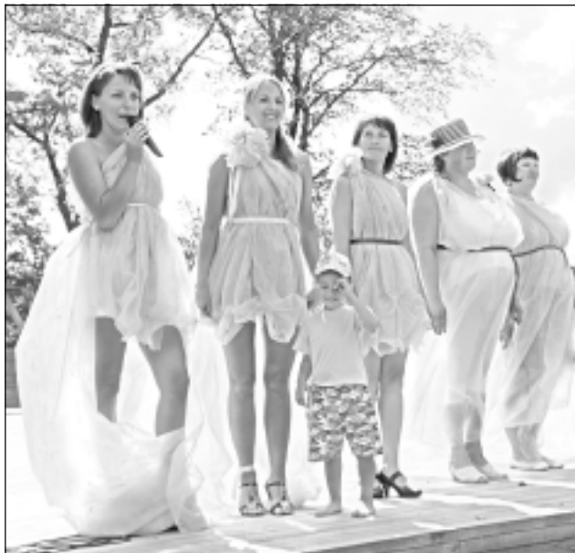
Kā līgavas. Rugāju sociālās aprūpes centra dāmas ne tikai atgādināja, bet arī ikdienā ir kā labās fejas, kas rūpējas par cilvēku labklājību.