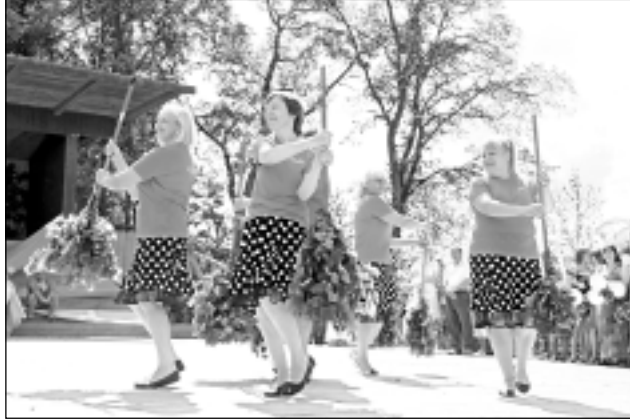
Laidiet slotas vaļā! Sieviešu deju kopas "Junora" meitenes pārsteidza ar gracioziem deju soļiem.