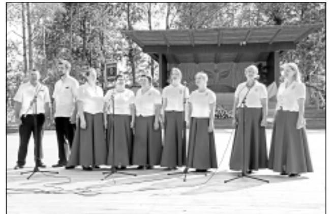
"Egle" Rugājos. Uzstājas folkloras kopa un kapela "Egle" no Medņevas.