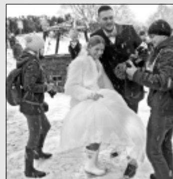
Gaisa balonos preti Ginesa rekordam.