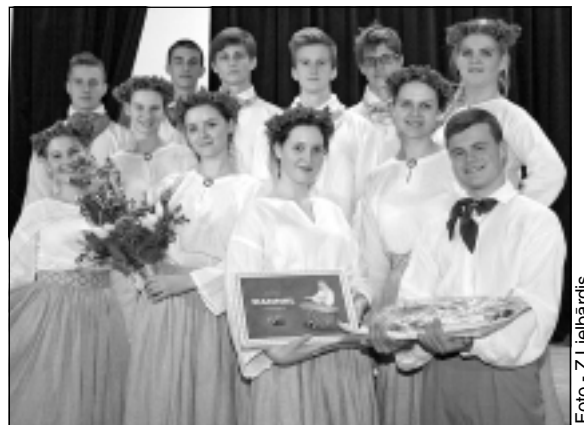
Balvu Valsts ģimnāzijas deju kolektīvs "Purenīte". Viņi priecājās savā skolā uzņemt ciemiņus ne tikai no kaimiņu novadiem, bet arī no Igaunijas.