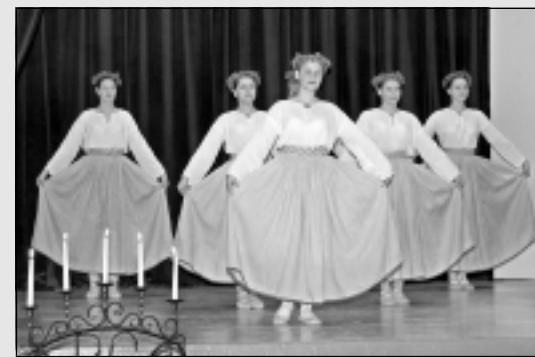
"Sadanci" riko jau sesto reizi.