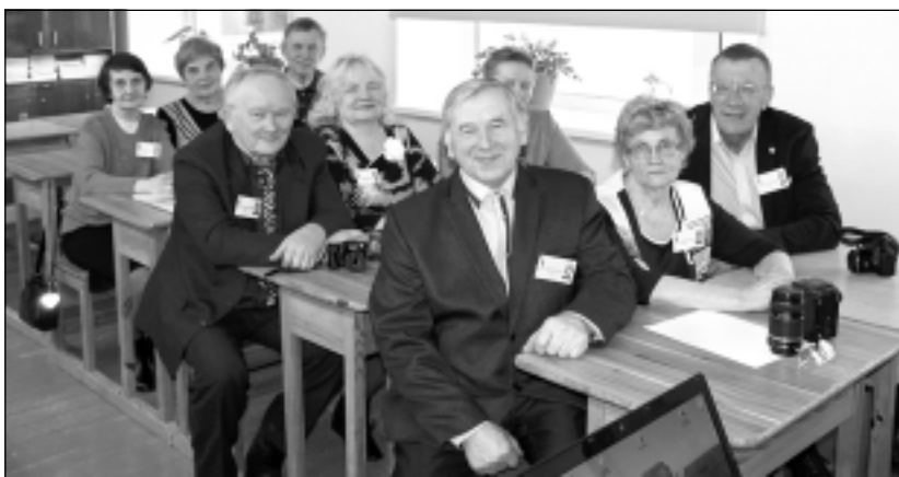
Satiekas pēc 50 gadiem. Skolas solā pasēdēt un atkal iejusties skolēnu ādā bija ieradusies Balvu vidusskolas 1966.gada absolventi.

arī deju kopas "Purenīte" dejas, dalībnieki turpināja darbu vēstures kabinetā. Konferencē piedalījās piecu valsts ģimnāziju komandas: Balvu Valsts ģimnāzija, Rīgas 1.Valsts ģimnāzija, Gulbenes novada Valsts ģimnāzija, Viļakas Valsts ģimnāzija un Valmieras Valsts ģimnāzija. Šī gada konferences tēma bija "Skolotājs – vēstures notikumu liecinieks". Konferencē ievadīja skolotāja Irēna dalījās stāstījumā "Skola un skolotājs Balvos laikmetu griežos", parādot arī grāmatas, kurās pētīts un stāstīts par Balvu skolām. Arī jaunajā grāmatā "Sports Ziemeļlatgalē: ceļš līdz Olimpiskajai medaļai" ir daudz materiāla par Balvu skolu sportiskajiem sasniegumiem, viņu sporta skolotājiem un treneriem, kuri palīdzējuši audzēkņiem sasniegt augstus rezultātus. Skolotāja grāmatu uzdāvināja savai dzimtajai skolai – Viļakas vidusskolai, kas kopš 1996.gada ir Valsts ģimnāzija, sakot, ka tajā ir arī materiāls par Viļakas skolas absolventiem un skolotājiem. "Ar lielu aizrautību gan skolēni, gan skolotāji darbojās meistarklasē "Kāds ir labs skolotājs?", kuras sākumā grupām vajadzēja uzrakstīt, kādas desmit īpašības būtu nepieciešamas labam skolotājam. Pēc darba prezentācijām secinājām, ka labs skolotājam ir iedvesmojošs, ar humoru apveltīts, izcili pārzina savu priekšmetu utt., vārdu sakot, gandrīz vai pārcilvēks. Varbūt labāk - sakarīgs skolotājs?" smaidot stāsta Irēna.